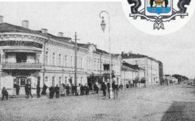
Великий Новгород начала XX века