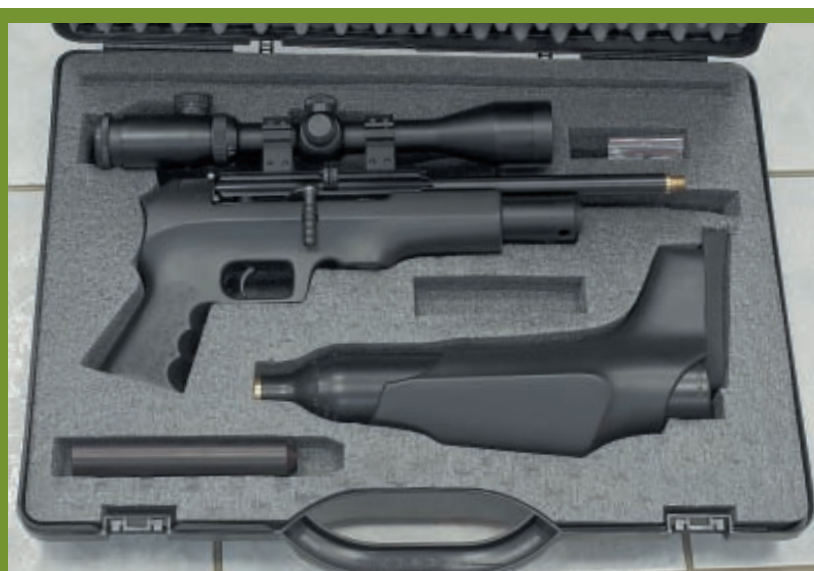
Для транспортировки Verminator разбирается на части и укладывается в комплектный кейс

На сегодняшний день в калибре 6,35 мм это, пожалуй, лучшая в мире РСР-винтовка. За счёт массивного ствола при выстреле исключаются даже малейшие вибрации, что обеспечивает винтовке исключительную точность. С тяжёлыми пулями «Барракуда» фирмы Haendler & Nattermann она сулит любителям охоты с пневматикой истинное удовольствие.