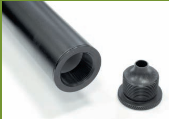
Несмотря на относительно небольшой объём, модератор FX Monsoon очень эффективно уменьшает звук выстрела. Может быть секрет в простом, но хитром профиле втулки?

пожалуй, только инновационные системы шведской компании FX-Airguns. Это модели FX Revolution и FX Monsoon. Первая модель в продаже появилась немногим более года назад, а вторая – всего лишь около полугода.