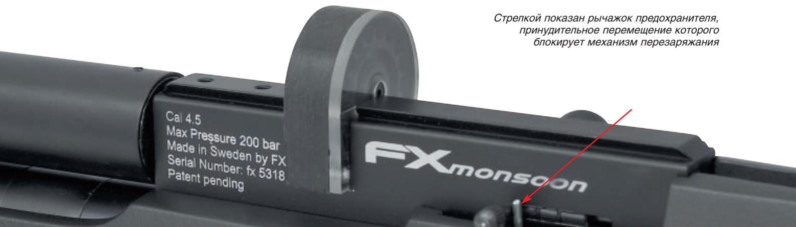
Стрелкой показан рычажок предохранителя, принудительное перемещение которого блокирует механизм перезаряжания

Cal: 4.5 Max Pressure 200 bar Made in Sweden by FX Serial Number: fx 5318 Patent pending