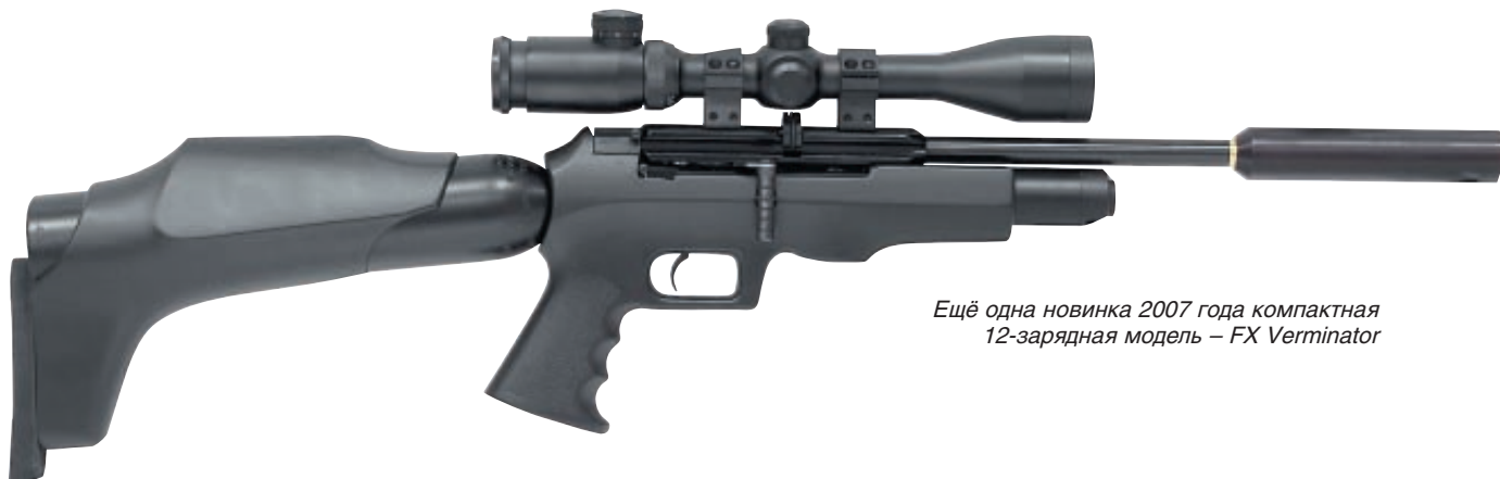
Ещё одна новинка 2007 года компактная 12-зарядная модель – FX Verminator

давления ниже рабочего просто перестаёт работать механизм автоматического перезаряжания. Практика подтверждает заверения производителя относительно запаса воздуха – одной заправки хватает на отстрел двух магазинов.