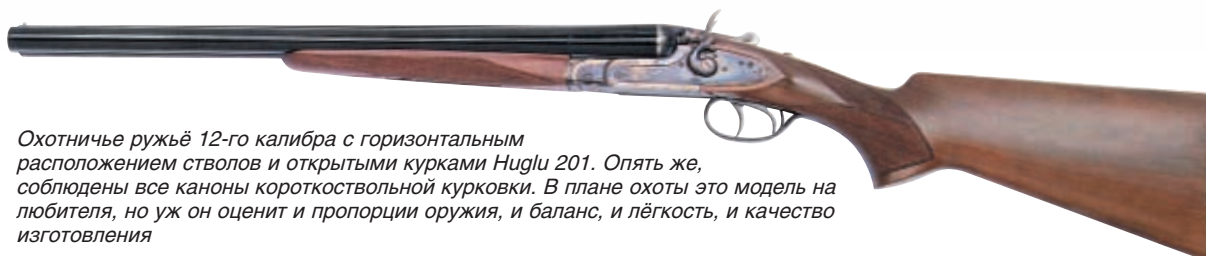
Охотничье ружьё 12-го калибра с горизонтальным расположением стволов и открытыми курками Huglu 201. Опять же, соблюдены все каноны короткоствольной курковки. В плане охоты это модель на любителя, но уж он оценит и пропорции оружия, и баланс, и лёгкость, и качество изготовления

З адача цивилизованного рынка сделать достойное предложение каждому потенциальному покупателю в соответствии с его финансовыми возможностями, обеспечив при этом возможность выбора.