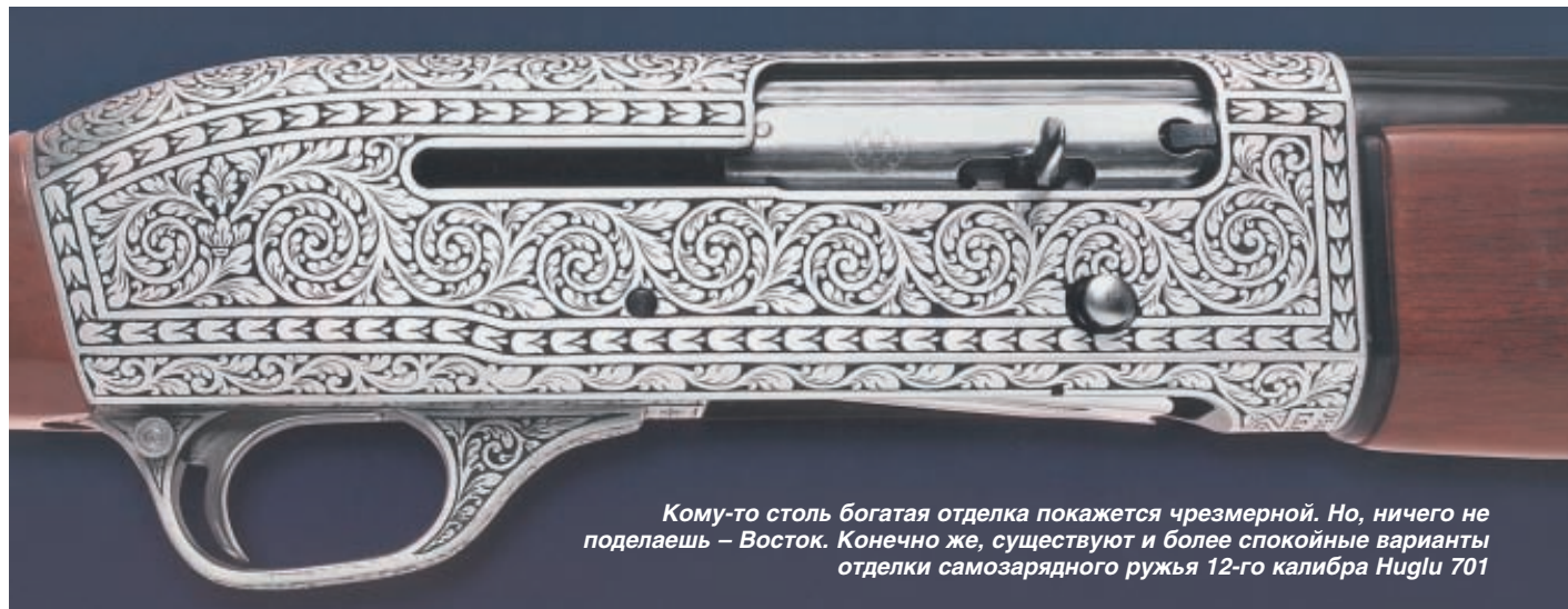
Кому-то столь богатая отделка покажется чрезмерной. Но, ничего не поделаешь – Восток. Конечно же, существуют и более спокойные варианты отделки самозарядного ружья 12-го калибра Huglu 701

достижений в создании космических кораблей, но, в плане самого современного оборудования и технологий, развивающаяся куда более динамично, чем большинство российских предприятий с вековой историей.