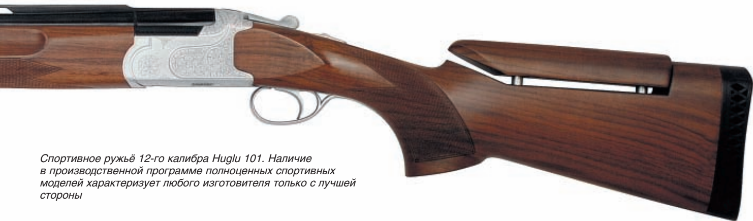
Спортивное ружьё 12-го калибра Huglu 101. Наличие в производственной программе полноценных спортивных моделей характеризует любого изготовителя только с лучшей стороны

живёт 3 500 человек, легко понять, что от благополучия кооператива здесь зависит каждый. О серьёзности подхода к изготовлению оружия говорит не только это. Много ли вы знаете предприятий полного цикла, выпускающих оружие калибров .410, 28, 20, 16 и 12? Это и горизонталки (в том числе курковки), и вертикалки, и полуавтоматы, и «помпы». Есть модификации и для спорта, и для охоты.