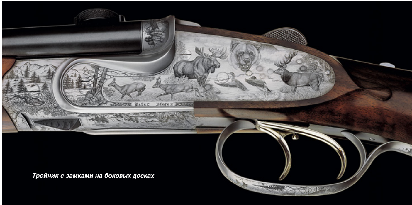
Тройник с замками на боковых досках

только одному владельцу и что двустволка «Рубенс» украшена самой тончайшей гравировкой из всех, какие когда-либо удавались человеку. Такое невозможно повторить. Петер Хофер надеется, что владелец этого ценного произведения искусства передаст его по наследству своим потомкам или продаст в именитый музей.