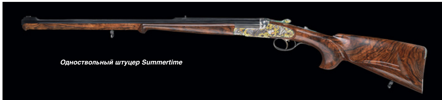
Одноствольный штуцер Summertime

Одноствольный штуцер Summertime украшен врезками из специального золотого сплава, благодаря чему в сочетании с тончайшей технологией гравировки буттини, когда под микроскопом на 1 кв. мм поверхности наносится 10 000 точек, достигается совершенно захватывающее великолепие красок. Впервые на этом ружье была применена уникальная технология эмалирования.