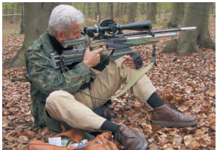
Позиция «сидя» с расположением оружия на левом колене стрелка. Такая позиция позволяет легко менять углы стрельбы при различной высоте мишеней