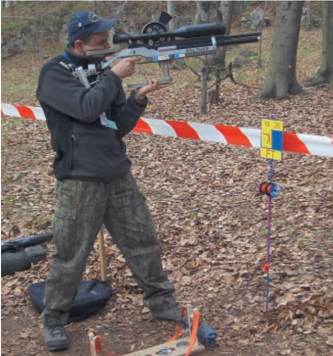
При стрельбе стоя стрелок использует дополнительный элемент удержания – «шампиньон». На табличке с номерами мишеней виден знак обозначающий, что мишень должна быть поражена стоя