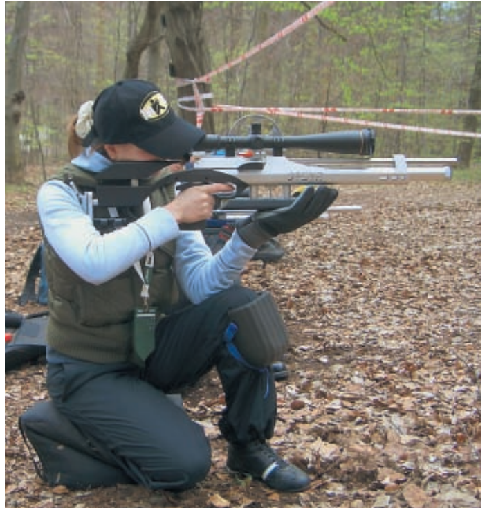
Положение стрелка при стрельбе «с колена». Подушка подложенная под голенистопо обеспечивает стрелку дополнительную опору

эксплуатации конструкция подушки не претерпела каких-то существенных изменений. Хотя по-прежнему встречается стрелки, пытающиеся изготовить альтернативу классической стрелковой подушке, как правило, эти варианты оказываются менее удобными.