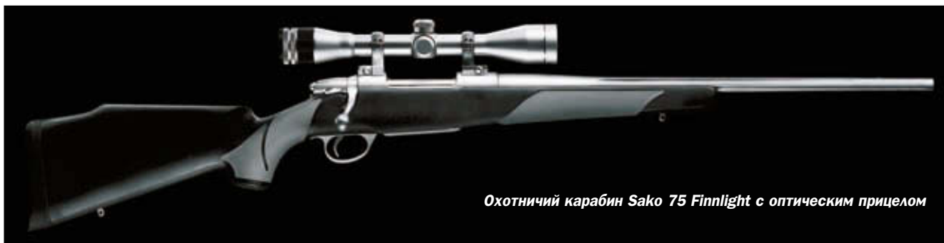
Охотничий карабин Sako 75 Finnlight с оптическим прицелом