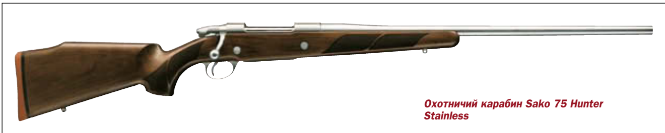
Охотничий карабин Sako 75 Hunter Stainless

групп, унификация которых позволяет потребителю получить варианты, например, 75 Hunter, 75 Hunter Stainless, 75 Deluxe, 75 Varmint, Stainless Synthetic, Battue и другие, под все патроны, выпускаемые компанией Sako. Свое 80-летие в 2001 г. Sako отметила выпуском юбилейной серии Sako 75 Safari – карабином ручной сборки высокого класса, выпускаемого под классический патрон калибра .375 Holland&Holland.