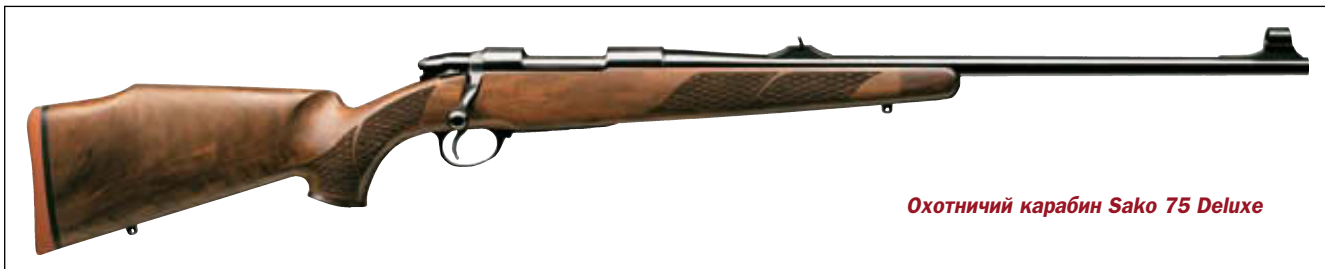
Охотничий карабин Sako 75 Deluxe