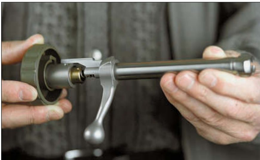
Для упрощения разборки-сборки затвора модели 75, в комплект карабина входит специальный пластмассовый ключ, не повреждающий покрытие металлических деталей

Всё оружие на Sako делают с нулевого цикла, начиная со своего сталелитейного производства и до готовой продукции, например, охотничьего карабина Sako 75-ой модели. Для наших охотников именно эта модель финского карабина и представляет наибольший интерес. Sako 75 был разработан и начал выпускаться в 1996 году – в год 75-летнего юбилея компании. Он представляет собой универсальный образец классического магазинного карабина с продольно-скользящим поворотным затвором. Модельный ряд содержит множество вариантов, различающихся назначением, отделкой и комплектацией. По калибрам используемых боеприпасов весь модельный ряд карабинов Sako 75 подразделяется на пять типоразмеров затворных