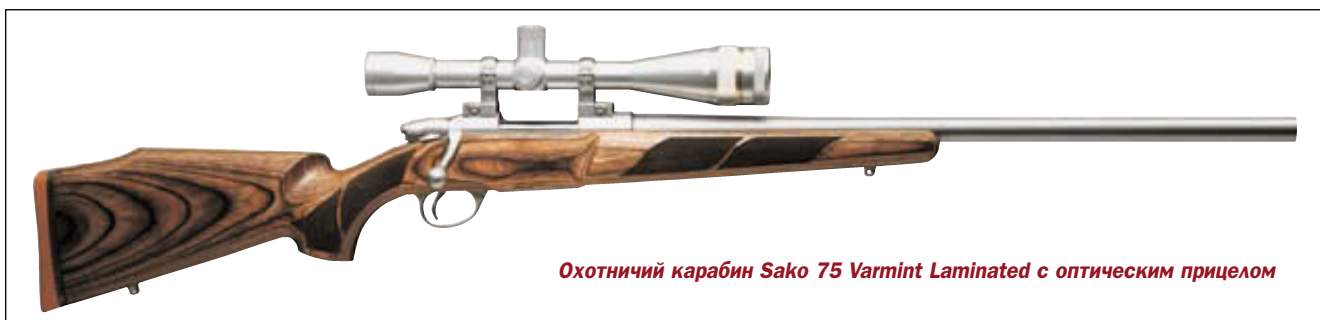
Охотничий карабин Sako 75 Varmint Laminated с оптическим прицелом

шенном с боевого взвода ударнике. При извлечении ключа затвор блокируется, исключая возможность заряжания оружия. В комплект поставки входят два рабочих ключа и один запасной. В случае утраты ключи могут быть изготовлены в сертифицированных мастерских фирмы Assa Abloy по образцу или номерному