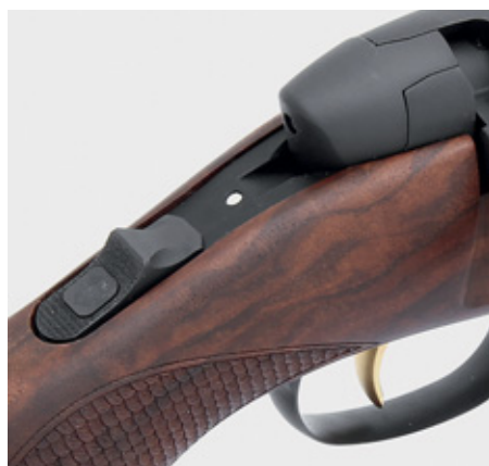
При перемещении ползуна в переднее положение (видна красная марка – положение «Огонь») ударник ставится на боевой взвод, о чём свидетельствует выступающий из затыльника затвора хвостовик. При последующих манипуляциях с перезаряданием оружия при активированном взводителе ударник взводится аналогично «нормальной» системе с поворотным затвором

Интересно, что, несмотря на принципиальные изменения в конструкции УСМ, затвор SM12 претерпел весьма незначительные изменения относительно предшественника. У него изменился затыльник, из которого теперь выступает ударник во взведённом положении, и появился вырез на одном из боевых упоров, предназначенный для облегчения поворота предохранительного кольца в узле запирания, фиксируемого подпружиненным шариком. Кстати, фиксируемое кольцо введено во все без исключения варианты SM12, независимо от калибра, тогда как ранее это была прерогатива исключительно мощных калибров. На данном элементе «Маннлихер» мог бы и сэкономить, но в итоге упрощённый вариант пал жертвой унификации, от которой, правда, потребитель выиграл больше теоретически, так как проблема несанкционированного поворота кольца никогда не стояла остро, а проявлялась исключительно у любителей поковыряться со своим оружием, не разобравшись в конструкции.