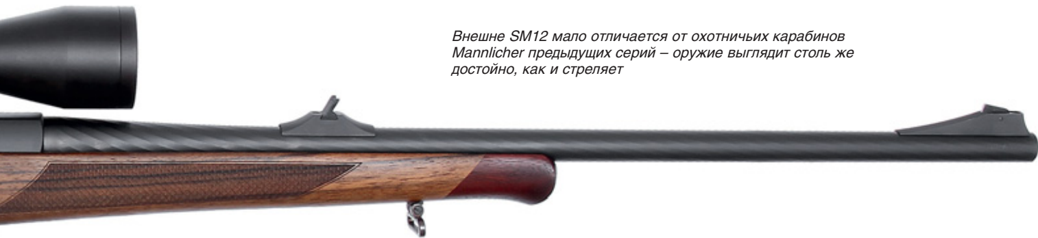
Внешне SM12 мало отличается от охотничьих карабинов Mannlicher предыдущих серий – оружие выглядит столь же достойно, как и стреляет

Ч то мы ожидаем от «Манлихера»? Прежде всего, премиального лоска. Steyr Mannlicher отступает от этого постулата только в боевом оружии и отдельных утилитарных моделях, таких, например, как Scout, концепция которого построена вокруг вариабельности и практичности при эксплуатации в тяжёлых условиях. Само собой, блестящее качество стрельбы подразумевается всегда.