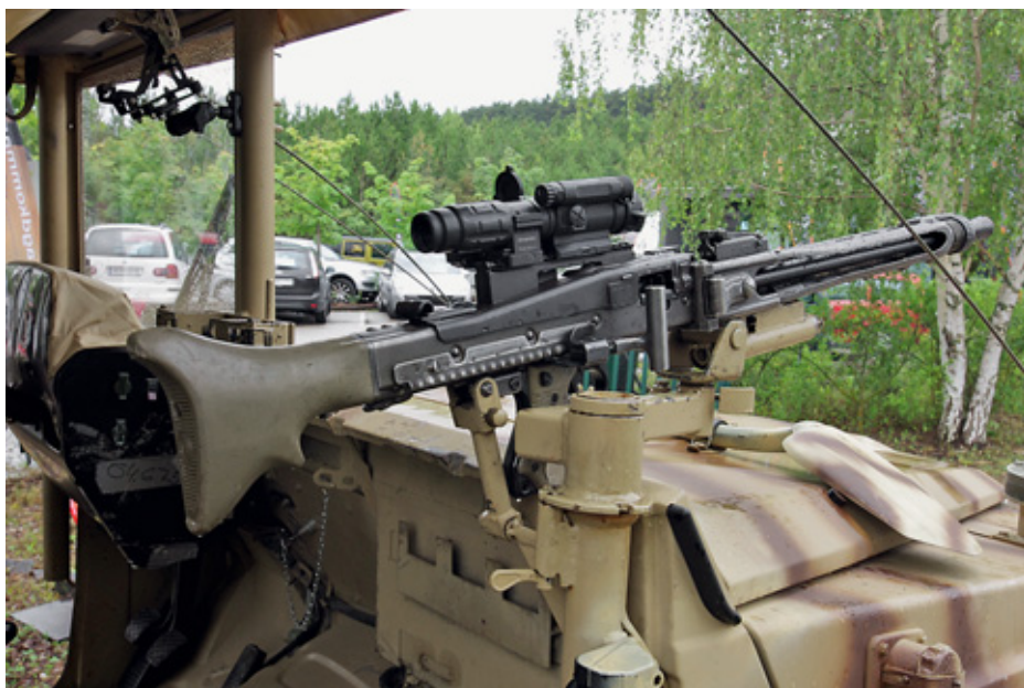
Несмотря на то, что Австрия является нейтральной страной, свои парашютно-десантные войска она оснащает по пустынной моде. Песочный «Гелендваген» в специальном исполнении оснащён двумя турельными пулемётными установками – одна на крыше, вторая на месте отсутствующей правой передней стойки крыши. Думаю, что даже мягкой европейской зимой эксплуатация такой спецмашины превращается в сплошные тяготы и лишения армейской службы. Кстати, немецкий Mercedes Gelandewagen на самом деле изготавливается в австрийском Граце...