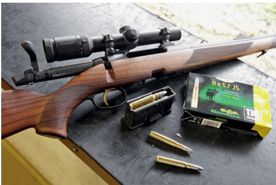
Магазин у SM12 двухрядный с полимерным корпусом. Он оснащён фирменной двухступенчатой защёлкой, которая позволяет фиксировать магазин в чуть опущенном состоянии, обеспечивая невозможность подачи патрона при работе затвором – предохранителей много не бывает