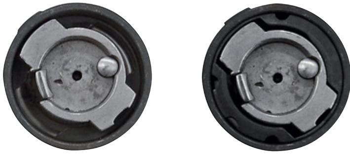
Вид спереди на узел запирания SM12 с поворотным кольцом и без него

В конструкции УСМ нового карабина сохранён шнеллер, выключаемый при отпирании затвора, но убрана блокировка затвора от отпирания при полном поджатии рукоятки к ложе, о которой напоминает глубокий вырез под стембель рукоятки, ставший на SM12 рудиментом. Я не совсем понял необходимость такой формы выреза и думаю, что при переходе на крупную серию ложи либо доработают, либо примут решение о возвращении блокировки, связав с ней механику взводителя.