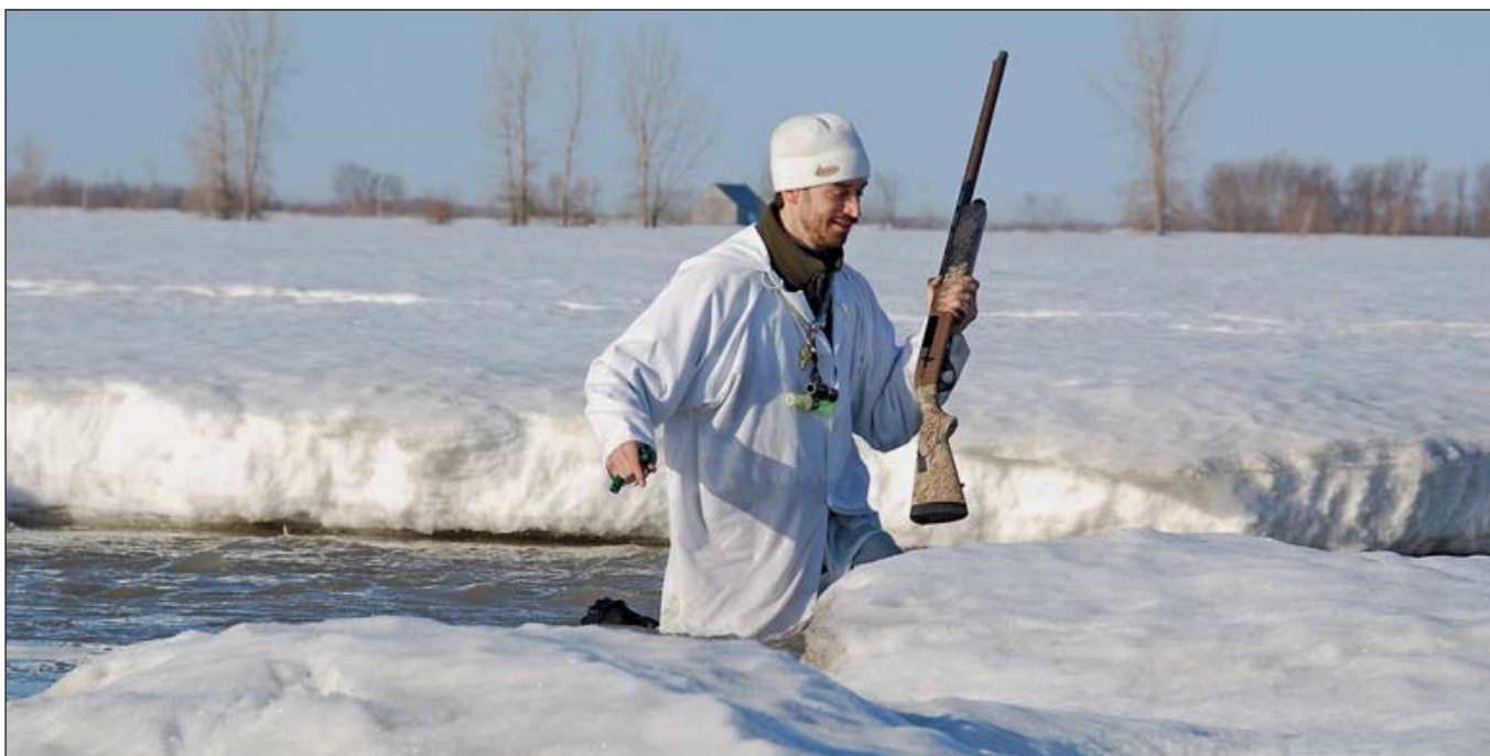
В суровые морозы, как, например, во время этой охоты на белых гусей в Квебеке, ружьям может потребоваться специальный уход