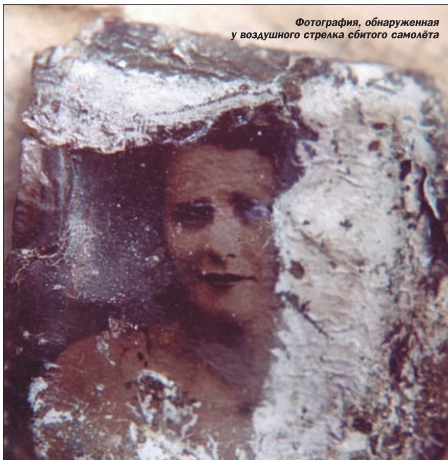
Фотография, обнаруженная у воздушного стрелка сбитого самолёта

Все находки, обнаруженные на месте падения самолёта, будут выставлены в музее военно-воздушных сил, а личные вещи лётчиков переданы родственникам, если они найдутся. Редакция журнала просит откликнуться родственников лётчиков и очевидцев последнего боя ИЛ-2.