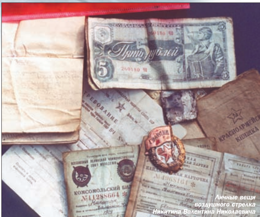
Личные вещи воздушного стрелка Никитина Валентина Николаевича

В архиве нашлось фото пилота. Полуистлевшая фотография стрел-