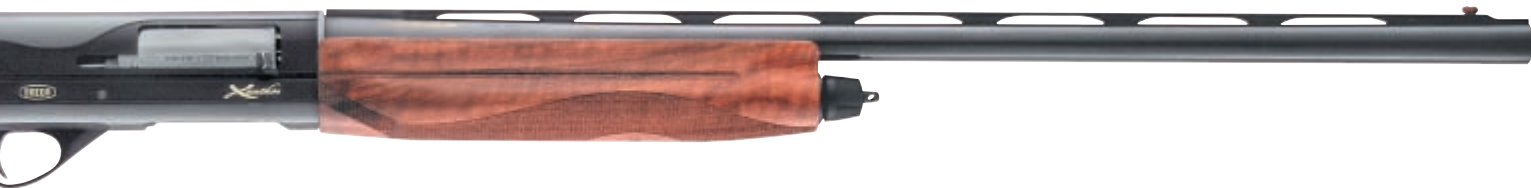
Самозарядное охотничье ружьё Breda Xanthos (12x76)