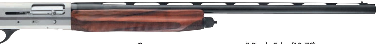
Самозарядное охотничье ружьё Breda Echo (12x76)