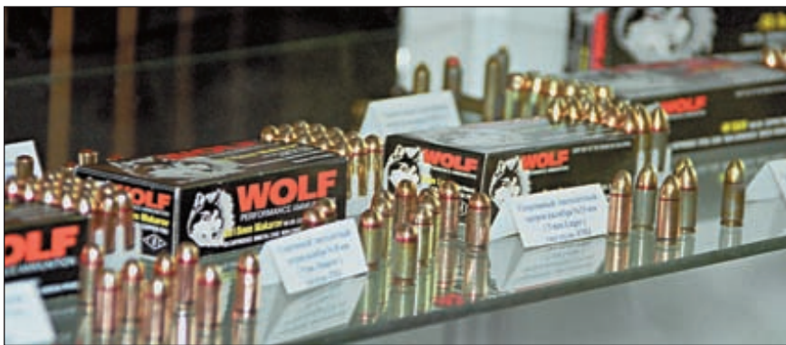
Среди экспонентов выставки РОСТ 2002 были практически все отечественные производители боеприпасов: Новосибирский завод низковольтной аппаратуры, Барнаульский станкостроительный завод, Ульяновский машиностроительный завод, Тульский патронный завод, Краснозаводский химический завод, «ПОЗИС», «Техкрим», «Искра». Кстати, в 2002 году фирма «Техкрим» получила право наносить на свои патроны с пулей «Бреннеке» фирменную маркировку от держателя этой торговой