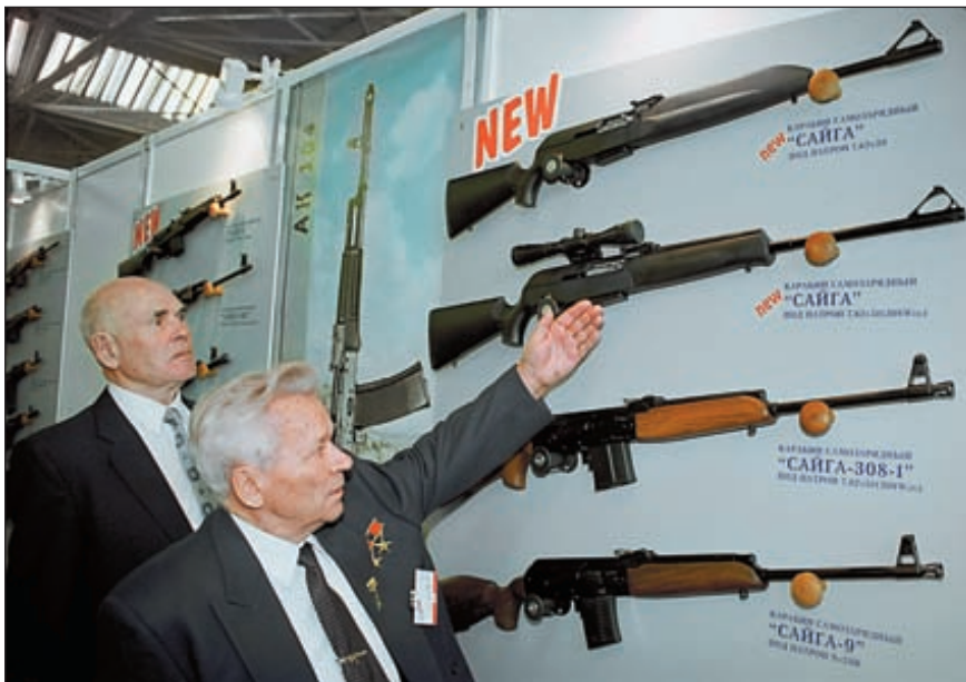
«Сайга» становится всё меньше и меньше похожей на своего прародителя – автомат Калашникова. «Сайга» «сотой» серии приобрела очертания явно охотничьего оружия и на фоне зарубежных самозарядных охотничьих карабинов своего класса без всяких скидок выглядит современным образцом