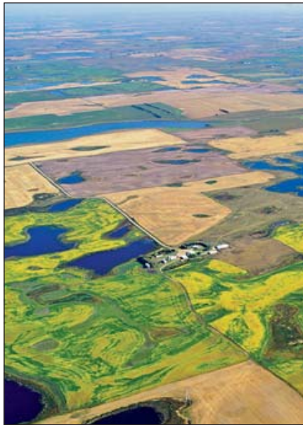
Аэрофотоснимок региона Северной Дакоты с котловинами в прерии – одними из самых продуктивных мест обитания в мире для водоплавающей дичи

Среда обитания водоплавающих птиц в обоих штатах Дакота улетучивается, равно как и природоохранные инициативы, которые поддерживали её сохранение.