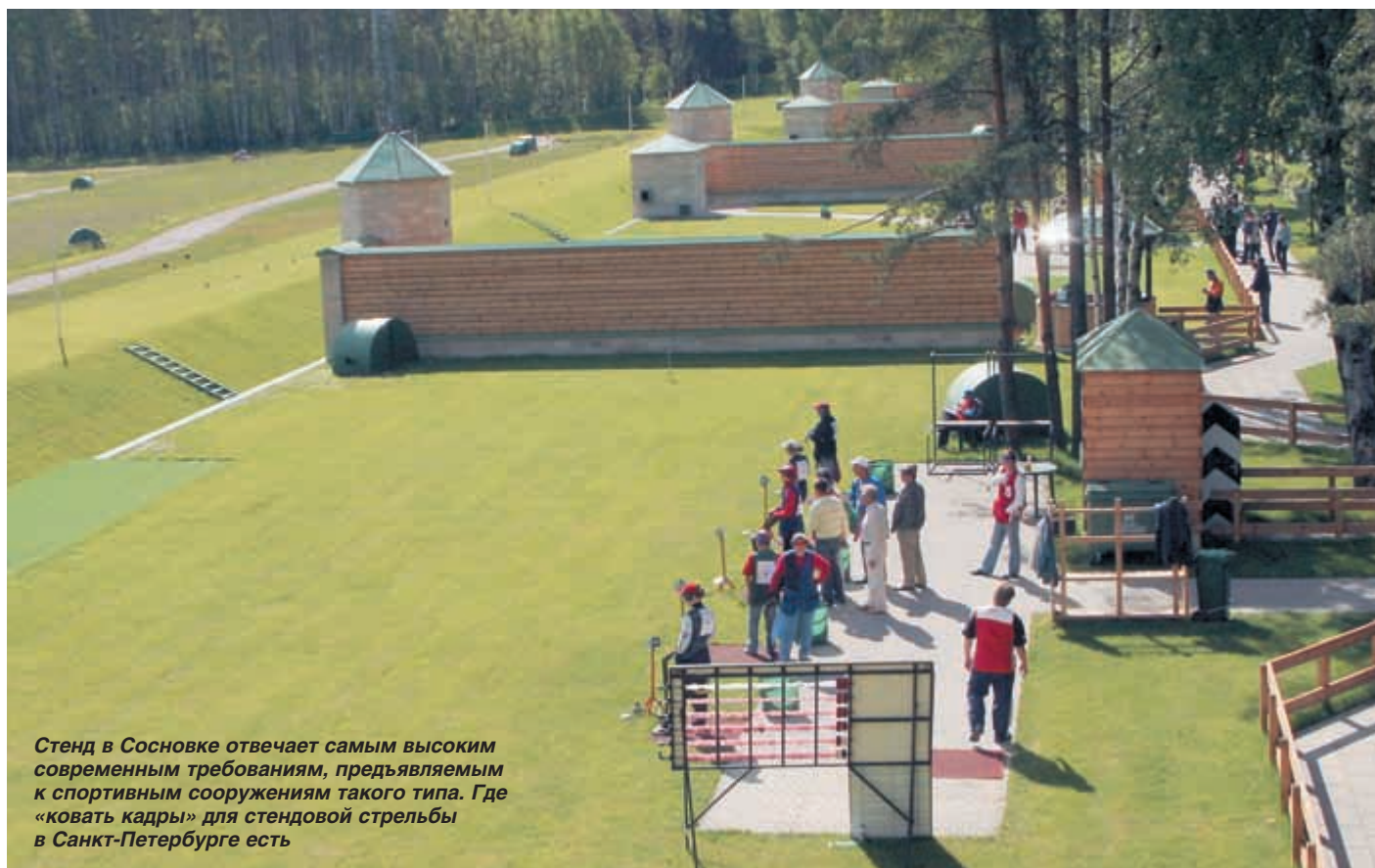
Стенд в Сосновке отвечает самым высоким современным требованиям, предъявляемым к спортивным сооружениям такого типа. Где «ковать кадры» для стендовой стрельбы в Санкт-Петербурге есть