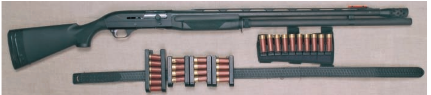
Ружьё для выступления в модифицированном классе

и самообороны из-за больших размеров магазина и увеличенного веса.