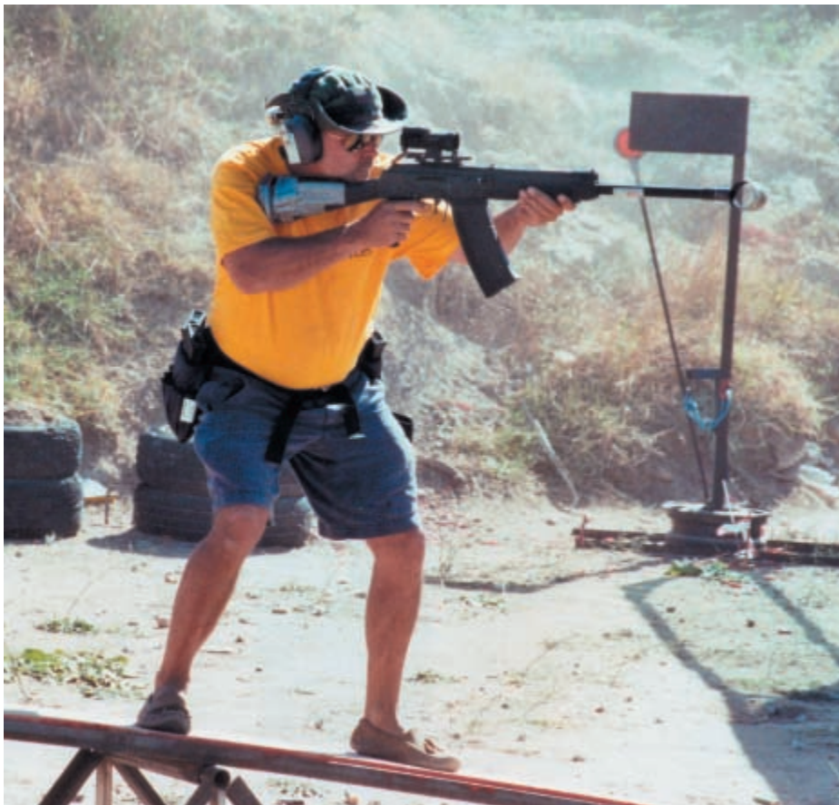
«Сайга» 12-го калибра, которая используется только в открытом классе – мечта зарубежных стрелков