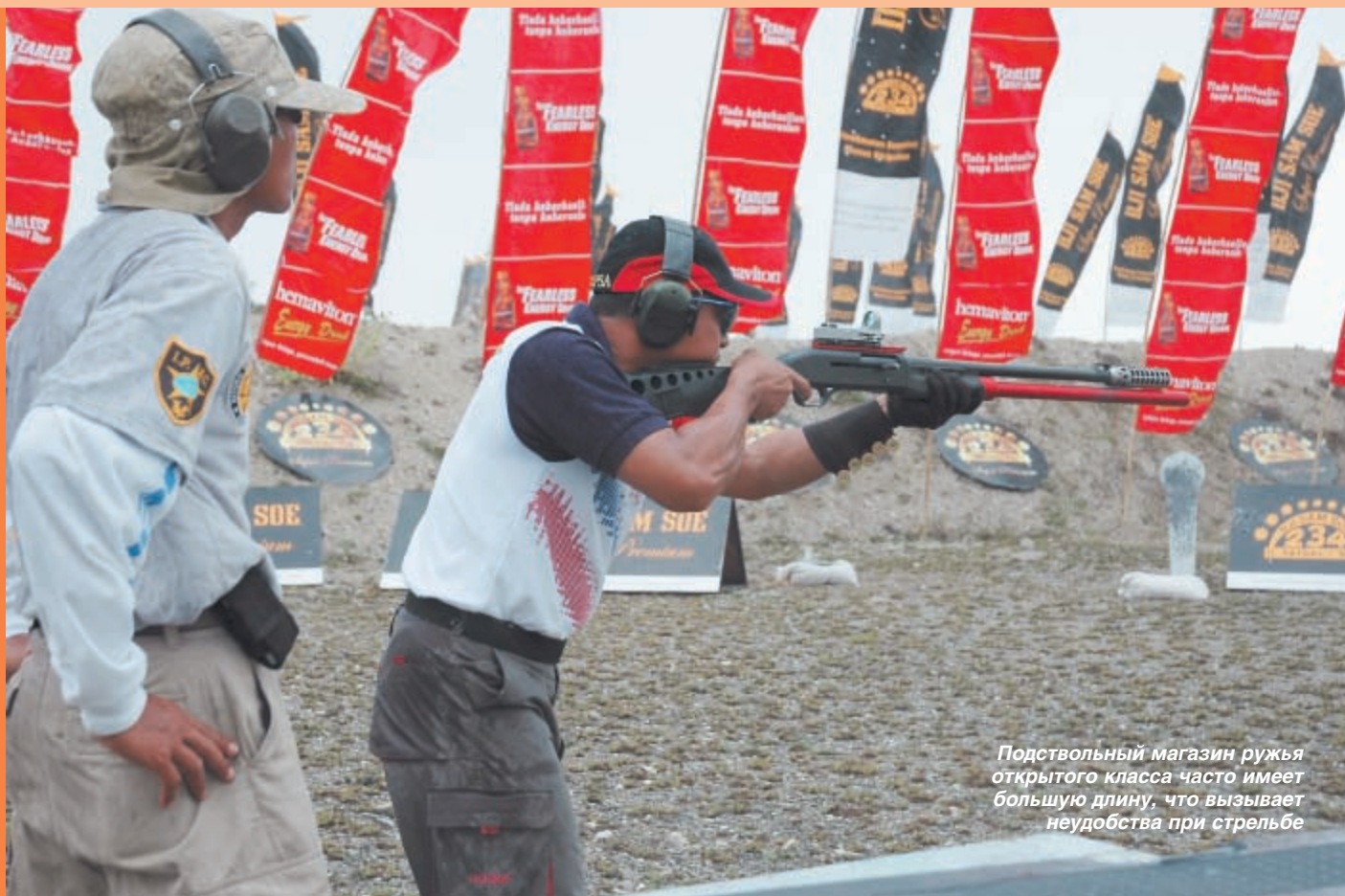
Подствольный магазин ружья открытого класса часто имеет большую длину, что вызывает неудобства при стрельбе