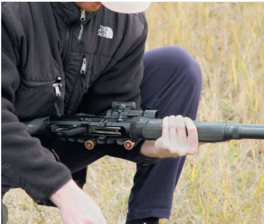
На ружьё стандартного класса разрешается крепить клипсы для удерживания патронов