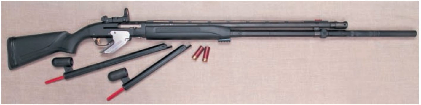
Ружьё для выступления в открытом классе