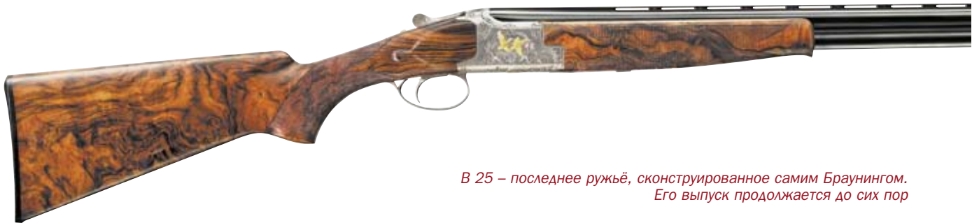
В 25 – последнее ружьё, сконструированное самим Браунингом. Его выпуск продолжается до сих пор

в производство ещё несколькими компаниями. К концу 1945 года суммарный выпуск пистолета составил более 2,5 млн. штук. С некоторыми частичными изменениями модель М 1911 А1 выпускается до сих пор и считается одним из наиболее мощных и распространённых в мире служебных пистолетов. Классическая модель, так же как и её многочисленные варианты, выпускается в Америке, Канаде, Аргентине, Бразилии, Китае и других странах. Особенно известными стали такие его варианты как Мк IV-70, Мк IV-80, а так же серия «90» с УСМ двойного действия.