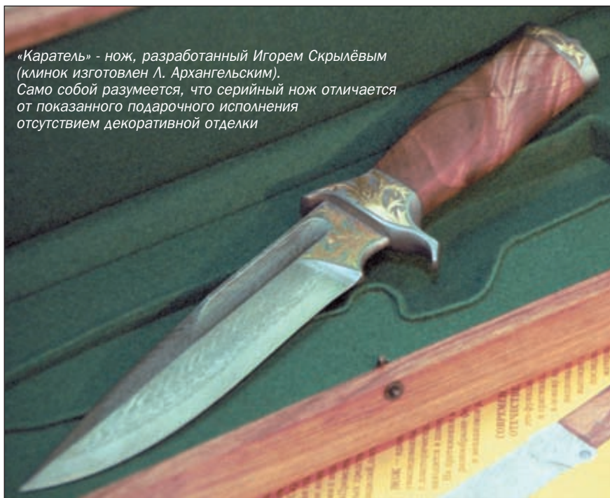
«Каратель» - нож, разработанный Игорем Скрылёвым (клинок изготовлен Л. Архангельским). Само собой разумеется, что серийный нож отличается от показанного подарочного исполнения отсутствием декоративной отделки