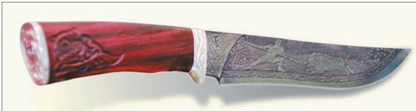
Нож, представленный на выставке «Русскими палатами», привлёк внимание сложным многослойным травлением на клинке, создающим эффект перспективы и многоплановости композиции охотничьей сцены