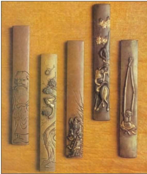
Козуки. Ножи, носившиеся вместе с мечом