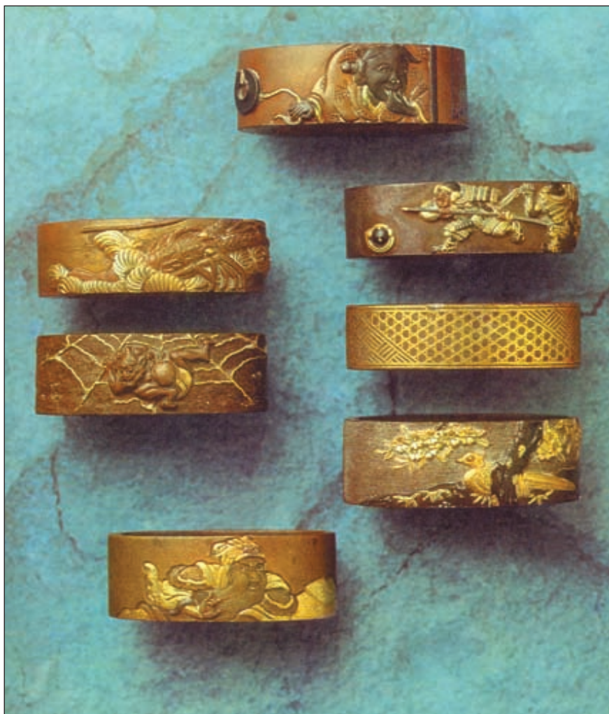
Фуси – нижнее кольцо рукояти возле цубы.

«Меж цветов красуется сакура, меж людей самураи» – так гласит японская пословица. Для простолюдина самурай был символом духовного и физического совершенства. На протяжении тринадцати веков существования этого воинского сословия самурай должен был быть воплощением конфуцианских добродетелей, наделенный, тем не менее, свирепостью Нио – стражей ворот буддийских храмов. Жизнь самурая подчинена была лишь закону гири – закону чести. Душой его был меч, а постоянными занятиями – война,