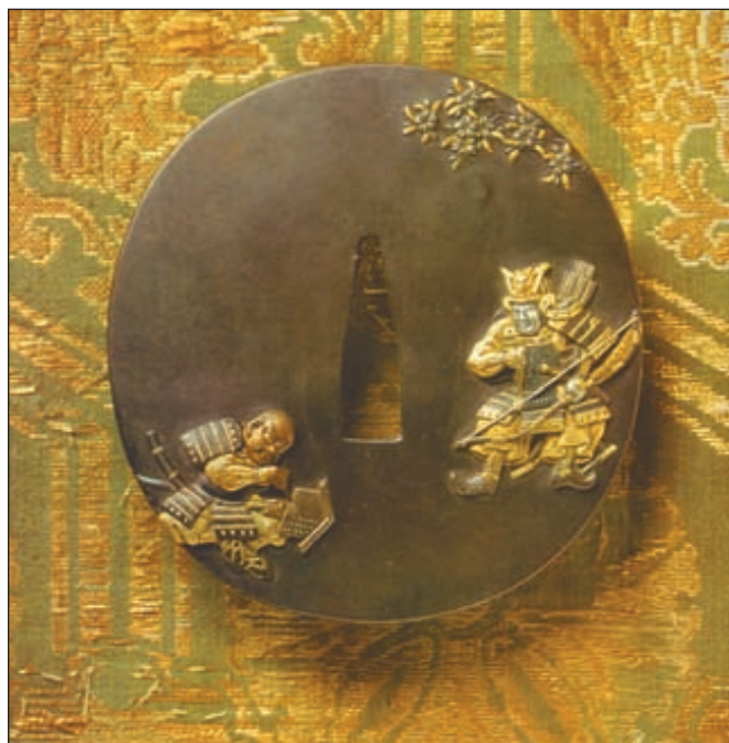
Цуба – фигурный щиток – гарда, защищающий руку бойца. Искусство украшения цубы оттачивалось веками

Цуба – фигурный щиток – гарда, защищающий руку бойца. Особо украшаемыми были кадзира – головка рукояти и фуси – нижнее кольцо рукояти возле цубы. Естественно, что все детали одного меча выполнялись в одном стиле. В той же манере выполнялся и козуки – небольшой кинжал носимый на самом мече. Именно прекрасное оформление привлекло поначалу европейских собирателей, которые, не интересуясь качеством клинка, приобретали цубы и менуки, разрушая целостное произведение – МЕЧ.