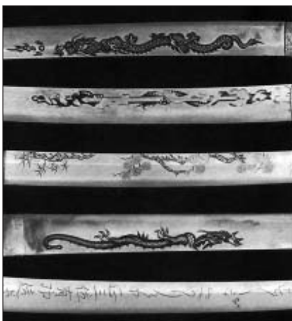
Виды декора клинка самурайского меча

лились на несколько категорий. Первыми в этом ряду стояли три ветви рода Токугава именуемые по их княжествам: Кии, Овари, Мито. За ними три более отдаленные родственные ветви Токугава – Таясу, Хитоцубаси и Симидзу, которые не имели замков в своих владениях, жили в Эдо и занимали высшие посты в государственном аппарате. Далее располагались семьи наиболее преданные дому Токугава – их было 176 и замыкали эту высшую группу еще 86 семей.