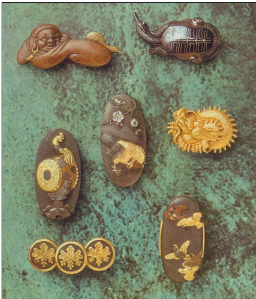
Менуки. Менуки – это маленькие декоративные головки клинышков, закрепляющих рукоять. Они располагаясь под оплеткой рукояти с обеих сторон

отверстия, сквозь которые продевались костяные заглушки.