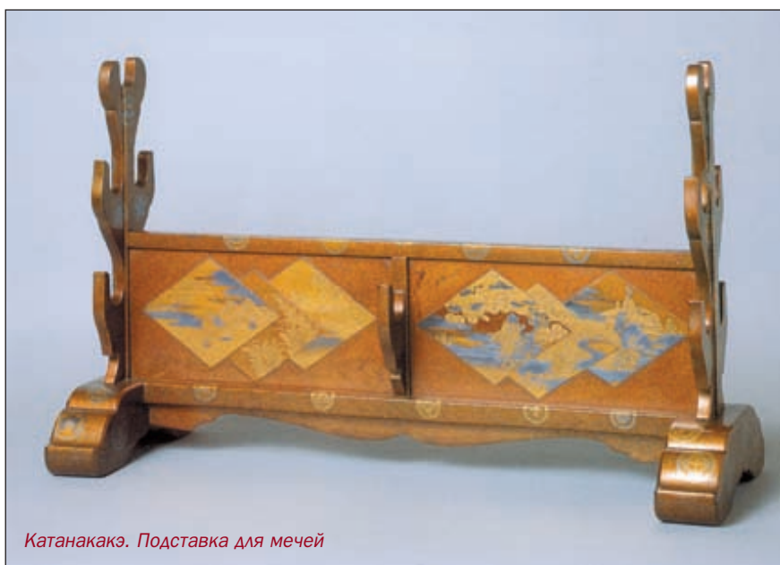
Катанакакэ. Подставка для мечей

Фуси были одними из наиболее украшаемых элементов меча