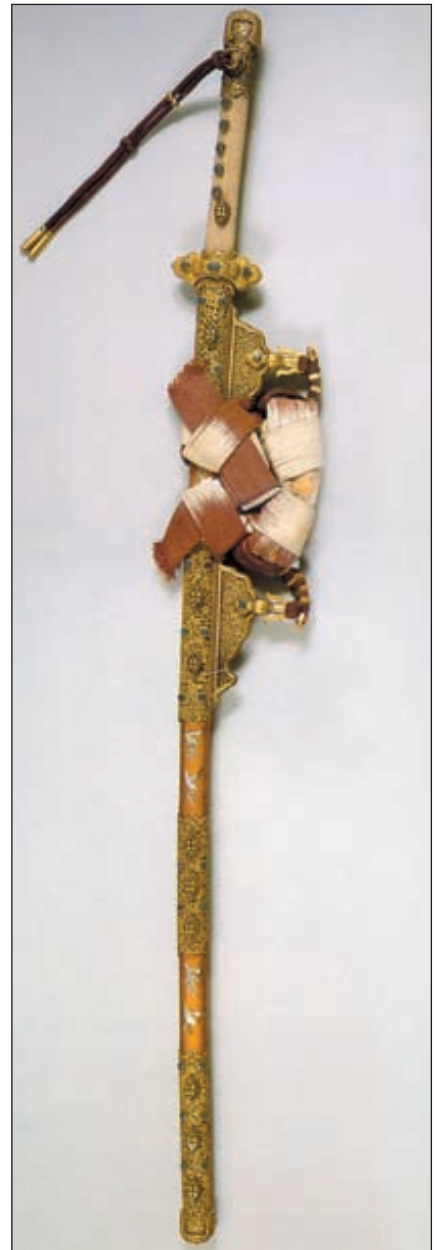
Тати. Тати - большой меч, длина которого приближается к 1,5-2 м. Имеет характерного вида крепления

Дзайсё (пара). В XVI веке мечи катана и вакидзаси стали носить заткнутыми за пояс, клинками вниз. С XVII века эти два меча стали называться единым понятием дайто-сёто или дзайсё (большой и малый мечи)