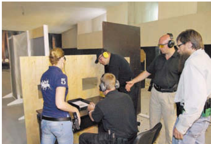
За день до прематча я застал в московской Академии практической стрельбы тренировку команды Службы безопасности Президента РФ

Замечу, что сам я воспитывался не в пажеском корпусе и работал в разных местах, в том числе таких, где физическая сила решает производственную