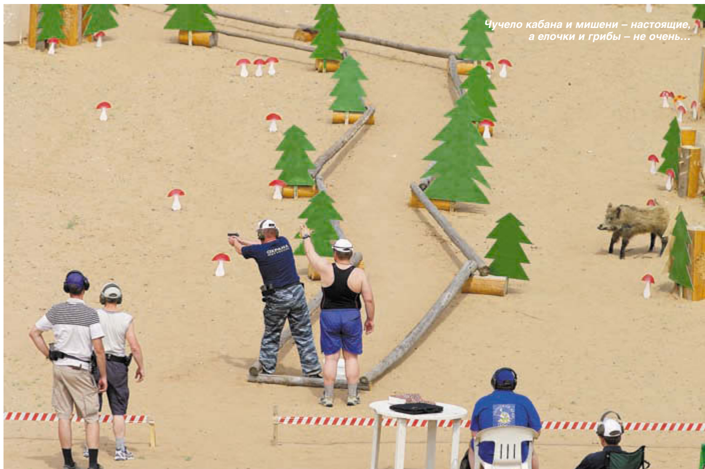
Чучело кабана и мишени – настоящие, а елочки и грибы – не очень...