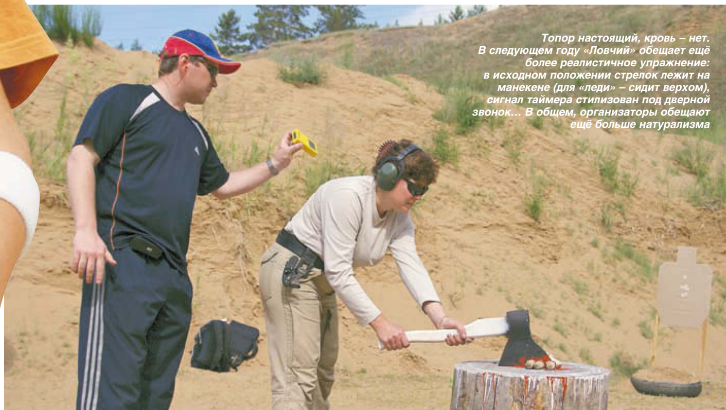
Топор настоящий, кровь – нет. В следующем году «Ловчий» обещает ещё более реалистичное упражнение: в исходном положении стрелок лежит на манекене (для «леди» – сидит верхом), сигнал таймера стилизован под дверной звонок... В общем, организаторы обещают ещё больше натурализма

Так вот, при всём уважении к богатству родного языка, я считаю нужным напомнить забывшимся коллегам по ФПСР простую истину: «высказываясь» в присутствии малознакомого человека, женщины или несовершеннолетнего, «оратор» демонстративно выказывает своё неуважение к окружающим. На соревнованиях присутствуют и незнакомые люди, и дамы, и дети и, если мы хотим, чтобы к нашему виду спорта относились серьёзно, то соответствующим образом нужно подходить не только к экипировке, но и к образу стрелка IPSC в целом.