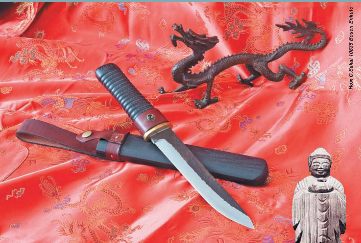
Нож G. Sakai 10835 Bosen Enkuto