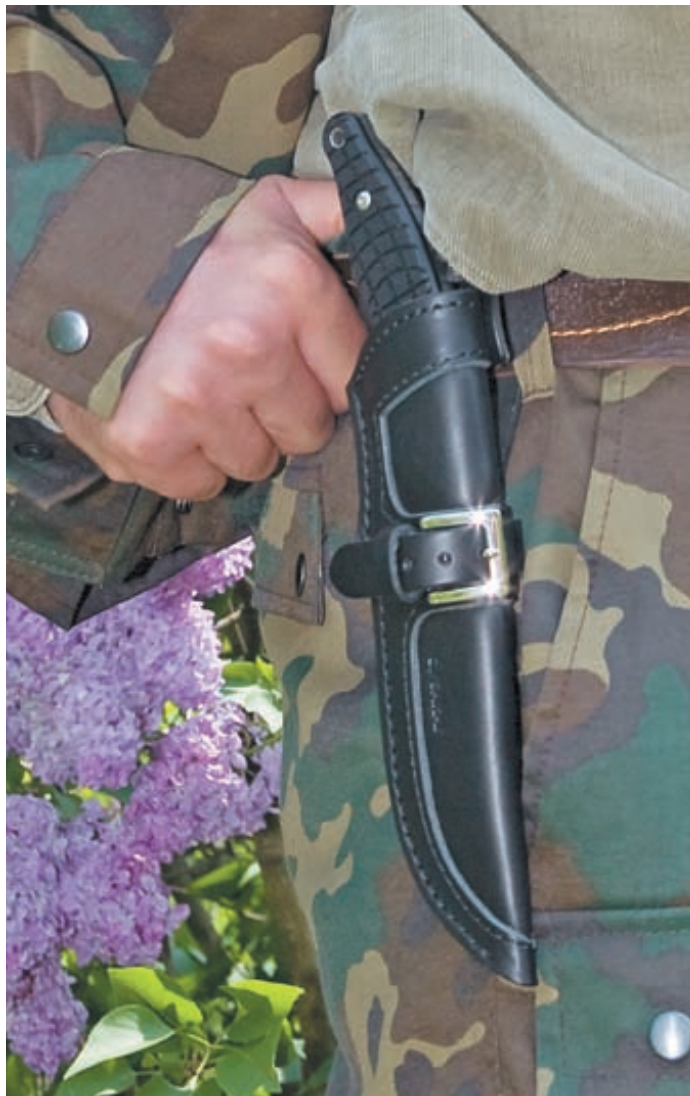
Кожаные ножны ножа Sakura имеют шикарный внешний вид

Что можно делать этим ножом? Да практически всё. И рубить мелкие деревья, и заросли рогоза и ивняка. Использовать в качестве оружия на охоте. Можно