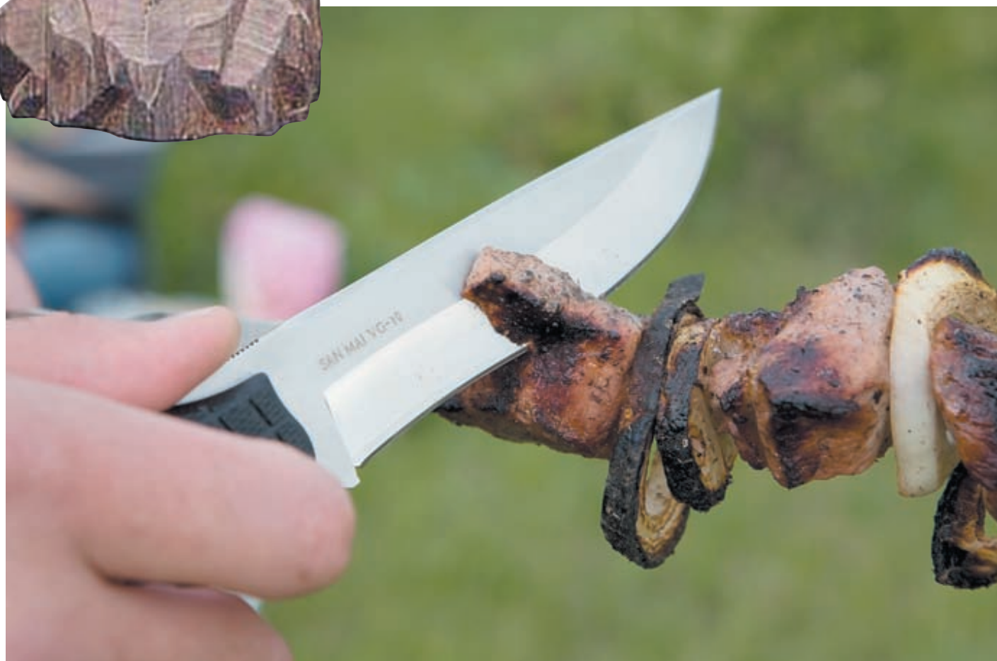
Нож G.Sakai Sakura отличает чистота реза и удобство в работе