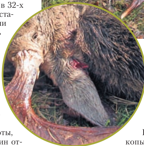
Туша поверженного 12-м выстрелом крупного лося оказалась простреленной в 4-х местах. В том числе «пострадало» и ухо. Где уж тут до гуманной охоты...

На открытии сезона охоты на копытных в октябре 2009 года я принял участие в коллективной загонной охоте на лося. Уже в первом загоне на линию стрелков загонщиками был выставлен огромный бык, который и был добыт... 12-м выстрелом четвёртого охотника. Туша лося оказалась простреленной в 4-х местах: задняя нога, живот, грудина и ухо... Вот так мы часто и стреляем.