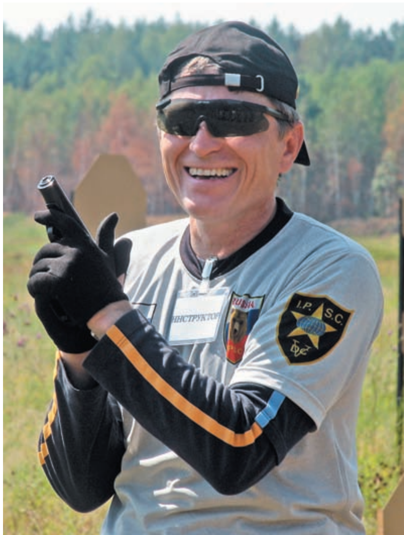
Автор статьи Анатолий Кондрух, председатель Центрального Совета ОСОО «Федерация практической стрельбы России»

Самое активное участие Россия приняла в зарубежных спортивных мероприятиях. Так, в сентябре в Сербию на чемпионат Европы по практической стрельбе из пистолета