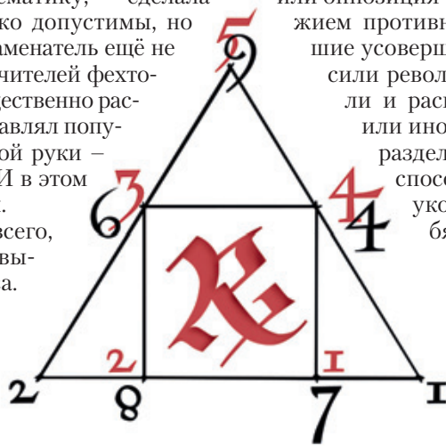
Классическая схема позиций колющего оружия. Красными цифрами обозначены сектора, черными - номера позиций. Художник Марк Штейн

Последним (в хронологическом смысле) нововведением в классическую нумерологию стала верхняя позиция колющего оружия,