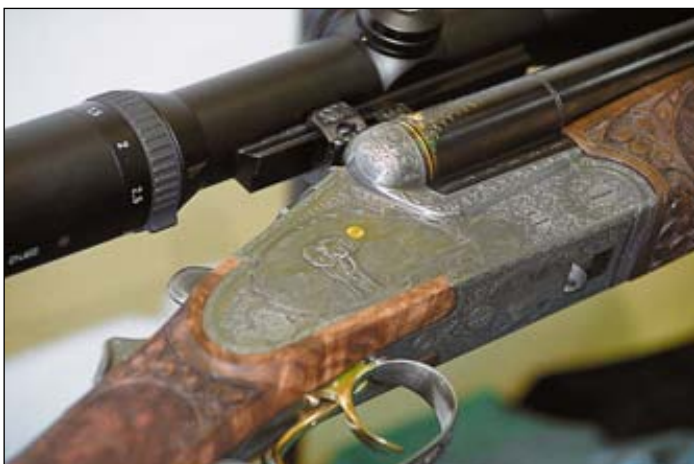
Этот четырёхствольный штуцер фирмы Heit изготовлен по заказу петербургского оружейного салона «Арсенал»