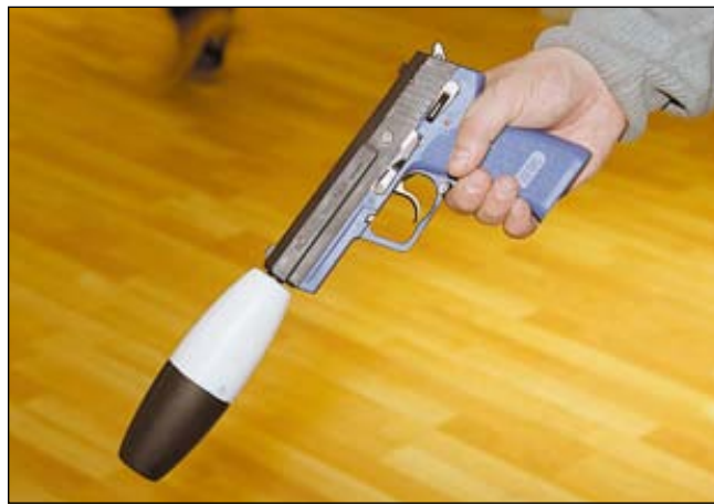
Такая пластиковая «граната» отстреливается вышибным патроном для натаскивания собаки на поиск битой на охоте птицы