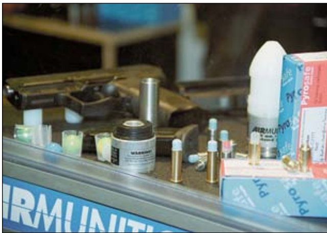
Комплекты для тренировочной стрельбы из пистолета на основе патронов со сжатым воздухом о которых «КАЛАШНИКОВ» писал в репортаже с прошлой выставки, дополнились вариантами для ружья 12-калибра и даже для