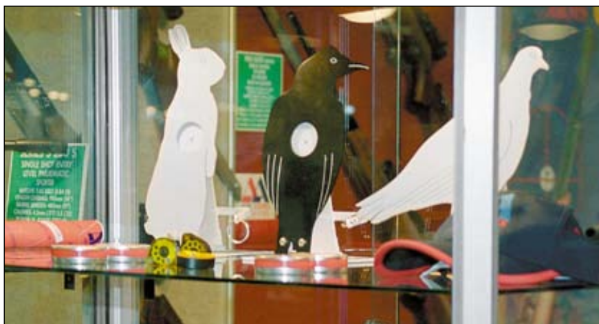
На стенде известного и в России изготовителя РСР-пневматики фирмы Air Arms были представлены винтовки, а также пули и металлические мишени для «филдтаргетинга»