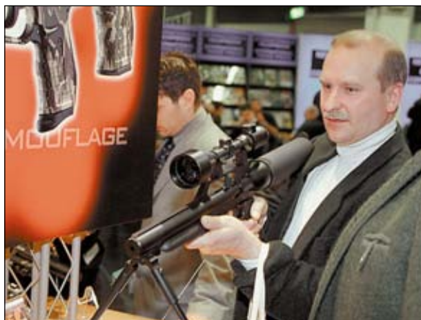
Большой интерес вызвала РСР-винтовка, показанная на стенде фирмы Umateg

изящество форм карабина, и это изящество недешево обошлось покупателю юбилейного R 93. Точная цифра не стала достоянием широкой общественности, но достоверно известно, что аукционная цена карабина превысила 100 000 евро.