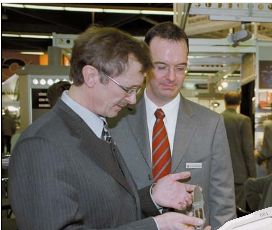
Директор златоустовской «Практики» осматривает нож «Калашников»

Стремление к универсализации образца прослеживалось в конструкциях и других фирм (насколько