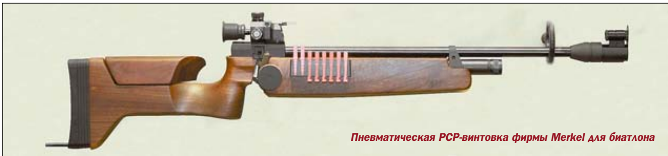
Пневматическая РСР-винтовка фирмы Merkel для биатлона