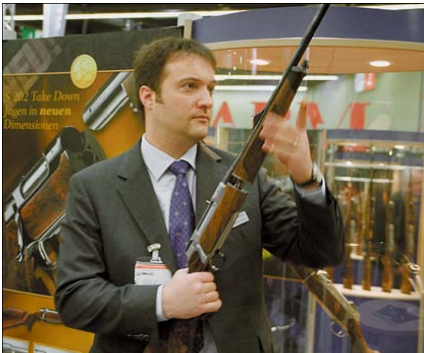
Для отделения цевья при смене ствола карабина Sauer 202 Take Down достаточно нажать кнопку

фиксации ствола и обеспечении необходимых моментов затяжки крепёжных винтов. В конструкцию узла крепления ствола карабина введён пакет тарельчатых пружин, который по идее проектировщиков, должен обеспечить единообразное положение ствола карабина независимо от момента затяжки крепёжного винта. С точки зрения многолетних традиций конструирования оружия (читай боевого оружия) в нашей стране это решение представляется безусловным. Однако французы считали, что для охотничьего карабина, который эксплуатируется в гораздо более «мягком» режиме такая схема вполне подходит. При этом сами разработчики говорят, что не добивались от оружия снайперских показателей кучности стрельбы, сделав упор на практичность и принцип достаточной необходимости.