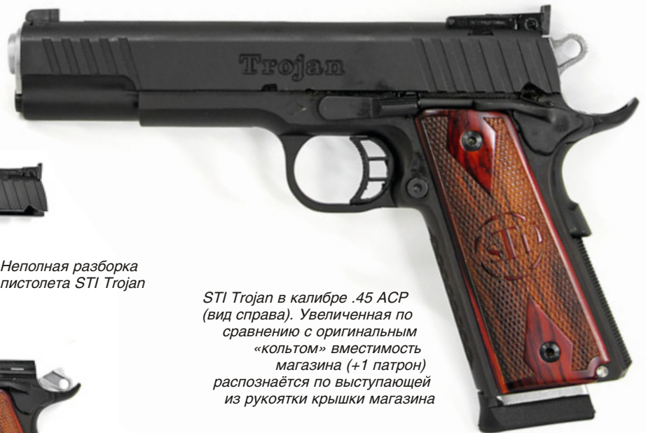
STI Trojan в калибре .45 ACP (вид справа). Увеличенная по сравнению с оригинальным «кольцом» вместимость магазина (+1 патрон) распознаётся по выступающей из рукоятки крышки магазина