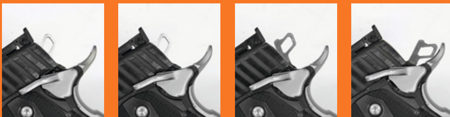
Все три пистолета оснащены фирменным «кольтовским» автоматическим предохранителем, клавиша которого расположена в верхней части спинки рукоятки и выжимается при правильном хвате. Флажковый предохранитель может занимать три положения у моделей Trojan и Edge (на фото) и два у Match Master – у его нет блокировки затвора, независимой от положения курка