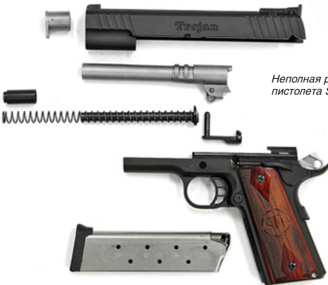
Неполная разборка пистолета STI Trojan

Во-первых, в их конструкции реализован «фирменный» возвратный механизм типа Recoil-master телескопического типа с двумя возвратными пружинами – внутренней и внешней. При этом внутренняя пружина установлена на своей направляющей, и её фиксирующая муфта (положение которой предопределяет