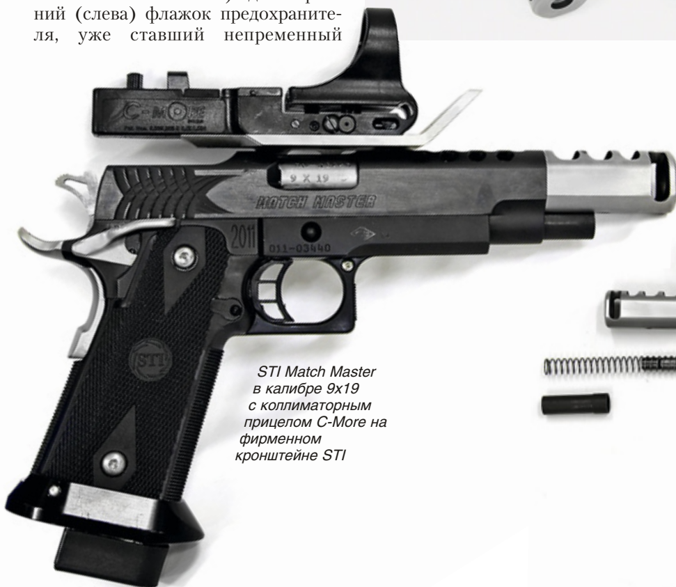
STI Match Master в калибре 9x19 с коллиматорным прицелом C-More на фирменном кронштейне STI

На этом снимке хорошо видны различные передние части рамок и возвратных механизмов. Обратите внимание на «закопчённый» щиток кронштейна на Match Master, предохраняющий коллиматорный прицел от удара пороховых газов, истекающих из отверстий тормоза-компенсатора