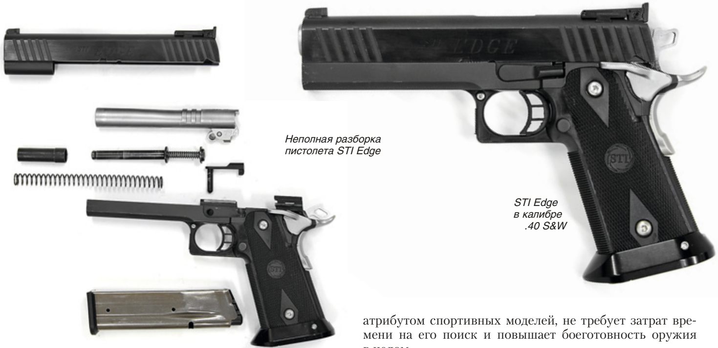
Неполная разборка пистолета STI Edge