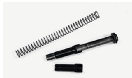
Для снятия-установки возвратных механизмов моделей Edge и Match Master используется пара сухарей (цанг), с помощью которых очень мощная внутренняя пружина фиксируется в сжатом положении