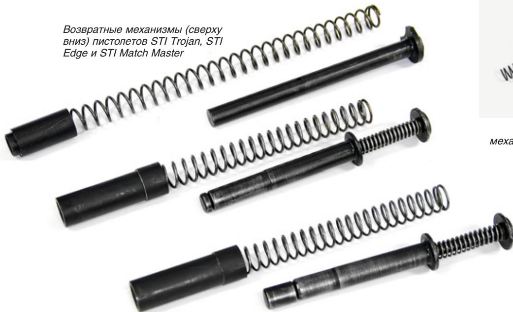
Возвратные механизмы (сверху вниз) пистолетов STI Trojan, STI Edge и STI Match Master

неполной разборки образцов требуют своего инструмента (цанги). Оба пистолета имеют пластмассовые рукоятки, выполненные заодно со спусковой скобой. Крепление рукояток к рамкам осуществлено четырьмя винтами с головками под шестигранный ключ из комплекта ЗиП (два верхних винта справа и слева на рукоятке и два винта спусковой скобы). Нижние винты рукоятки выполняют чисто декоративную функцию. Фиксация от самоотвинчивания при стрельбе произведена с помощью клея фиксатора и не подразумевает разборку. В нижней части рукояток пистолетов смонтирована горловина – направляющая магазина, которая фиксируется поперечной осью. Оба пистолета имеют двусторонний предохранитель рычажного типа с увеличенной длиной флажков. Питание пистолетов патронами производится из двухзарядных коробчатых магазинов, имеют специфическую (трапециевидную в поперечной плоскости) навивку. Крышки магазинов и пластины фиксаторы изготовлены из пластмассы, что может повлиять на их живучесть при стрельбе с площадок с твёрдым покрытием (подобное уже наблюдалось при эксплуатации отечественных пистолетов ПММ и «Викинг»). В этом смысле стоит отметить мягкие полимерные полы в галереях «Объекта», одновременно обладающие и противорикошетным эффектом и сохраняющие части оружия при падениях.