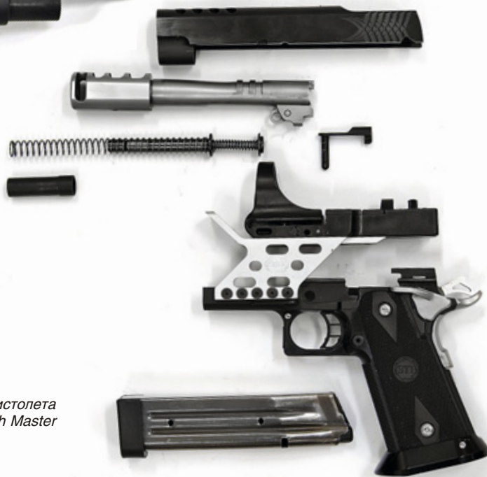
Неполная разборка пистолета STI Match Master