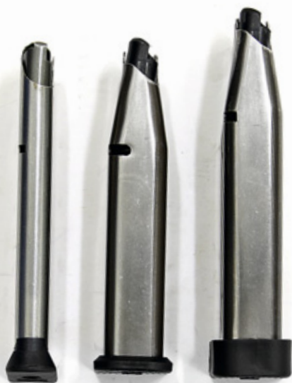
С магазинами для Edge и STI Match Master разных калибров нужно быть внимательным – они без проблем присоединяются к любому пистолету