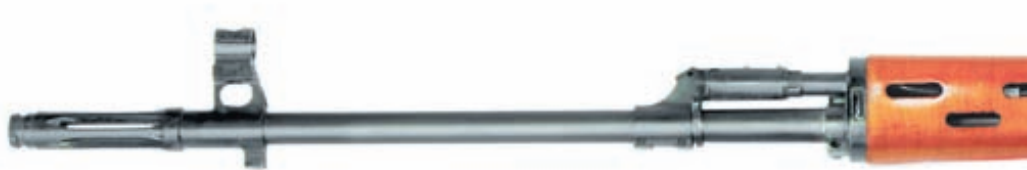
Общий вид СВД от компании Real Sword

«КАЛАШНИКОВ» продолжает знакомить читателя с новинками рынка страйкбольного оружия. На этот раз мы рассмотрим снайперскую винтовку СВД от гонконгской компании Real Sword International Industry Hong Kong Co Ltd.