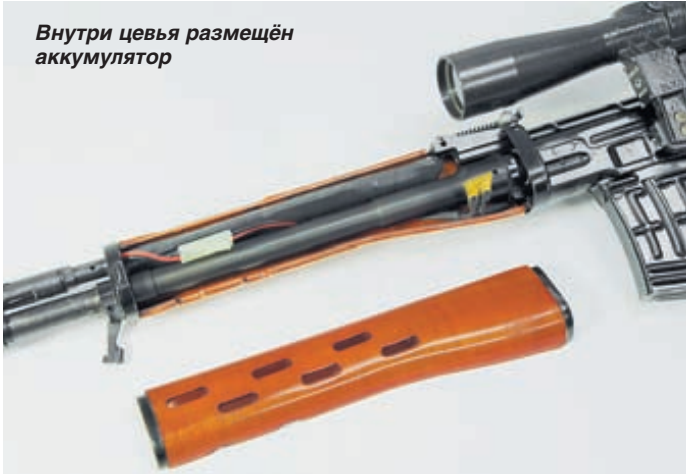
Внутри цевья размещён аккумулятор