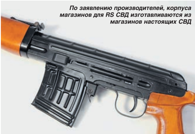
По заявлению производителей, корпуса магазинов для RS СВД изготавливаются из магазинов настоящих СВД

советуем поменять на что-нибудь более приличное. Аккумулятор емкостью 1400 мА/ч, 8,4 В – классический, можно применить и СУМА, и Classic Army, или любого другого производителя.