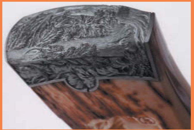
Фрагменты ножа «Медведь», ставшего лауреатом 1-го международного конкурса, проводившегося на выставке IWA 2000