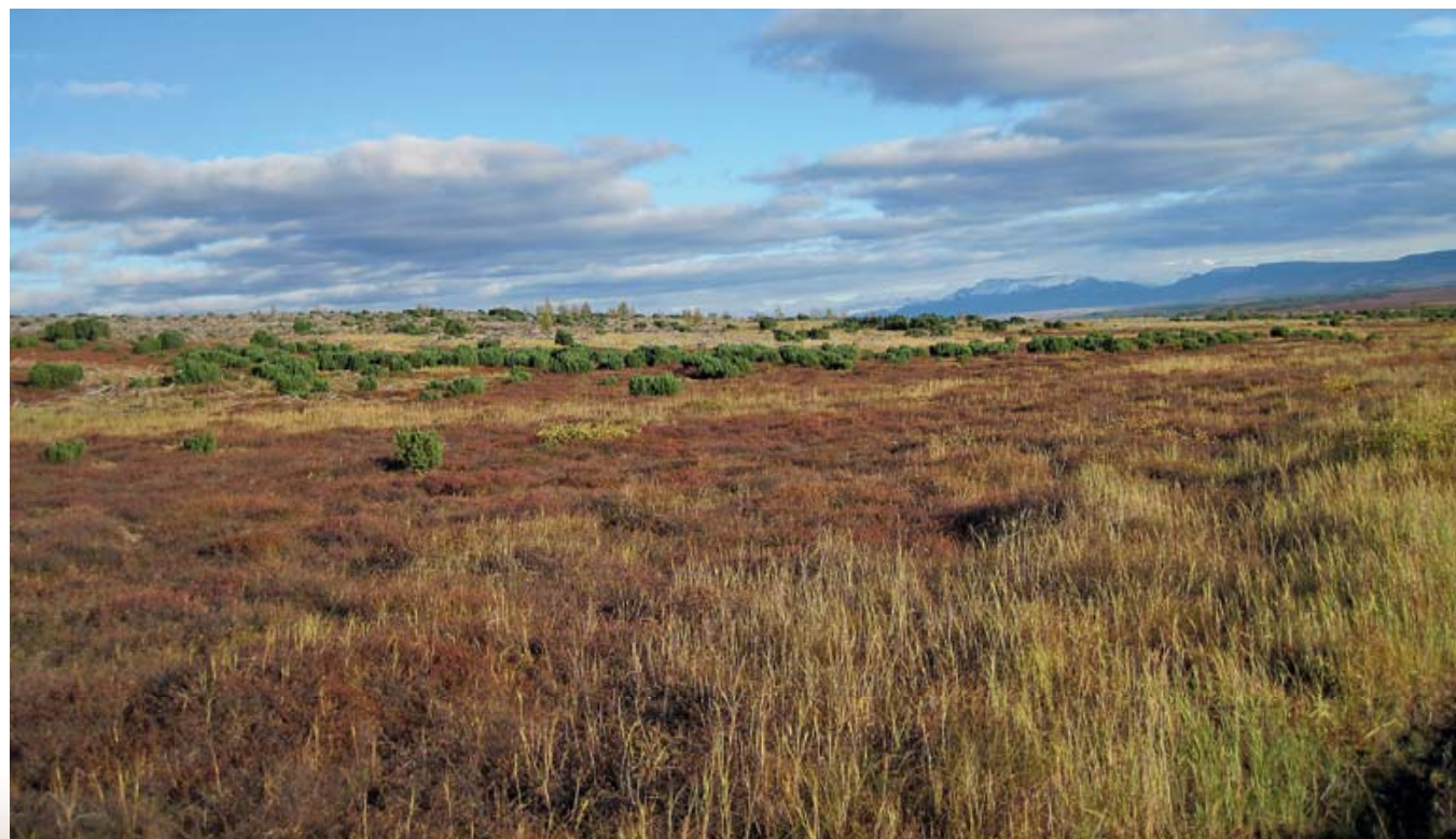
Островки кедрового стланика - любимое пристанище медведей

Снова тарыхтим по дороге. Через часок подъехали к маленькой речке, где попили чай из термосов,