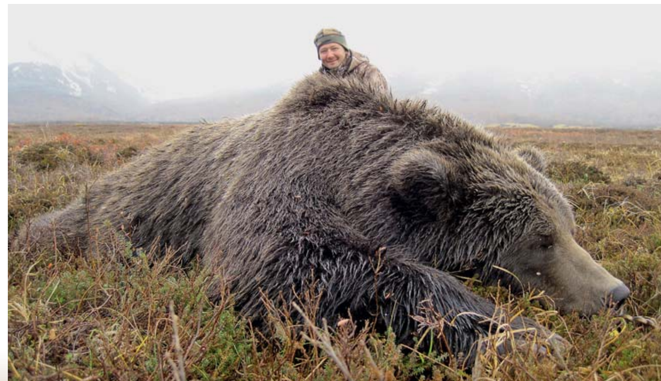
Отличный трофей камчатского бурого медведя