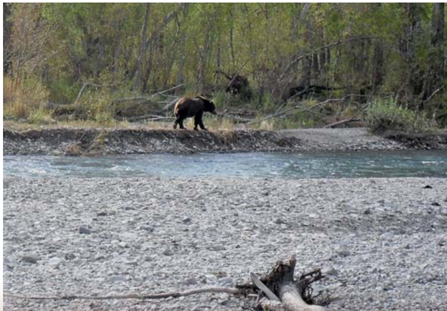
Нерестовые реки - основные станции медведя осенью

Встали рано, около 7 часов. На улице «дубак» – минус 3.