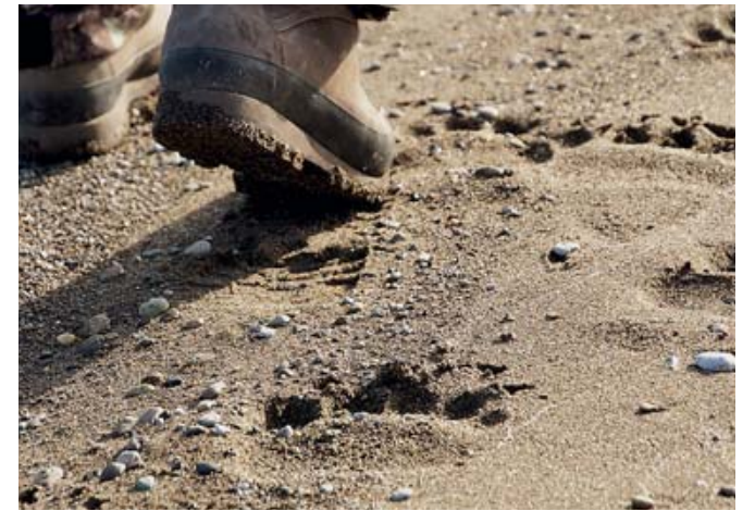
След человека тут встречается гораздо реже, чем медвежий

Ужинаем и разбредаемся по палаткам – день сегодня был очень насыщенный. Снег не прекращается.