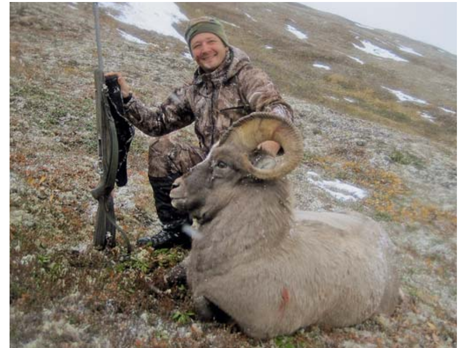
Я и мой первый камчатский баран. Этот трофей я запомню навсегда!

В долине дует, как в аэродинамической трубе – т.е. постоянно не менее 2–3 м/с, а порывы бывают и до 10 (судя по показаниям карманной метеостанции Kestrel). Палатки располагаем узкой стенкой против ветра и тщательно укрепляем их. Пока ставим лагерь – начинает холодеть и темнеть. Ужинаем, травим истории из охотничьей жизни и про приключения общих знакомых, коих, учитывая узость охотничьей тусовки, оказывается весьма немало. Наконец расходимся спать. Засыпаем под ураганные