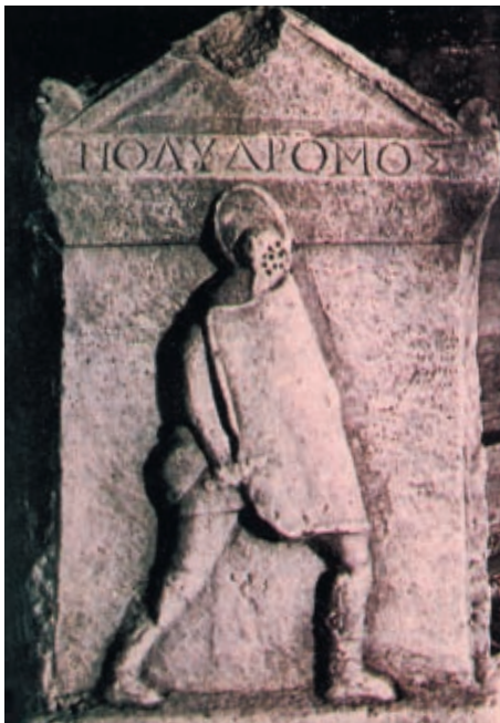
Надгробие секатора Пелидрома с острова Лесбос

Римская же античность вообще перевернула всё с ног на голову, сделав развитое фехтование профессиональным уделом рабов-гладиаторов. Характерно, что правда жизни всё