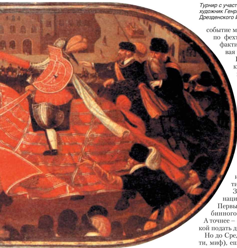
Турнир с участием курфюрста Августа Саксонского (придворный художник Генрих Гёдинг, середина XVI в.). Из собрания Дрезденского Исторического музея

событие мероприятия – международные соревнования по фехтованию. Первые в мире, подтверждённые фактически (в виде фрескового отчёта). И – первая в мире фехтовальная нечестность!