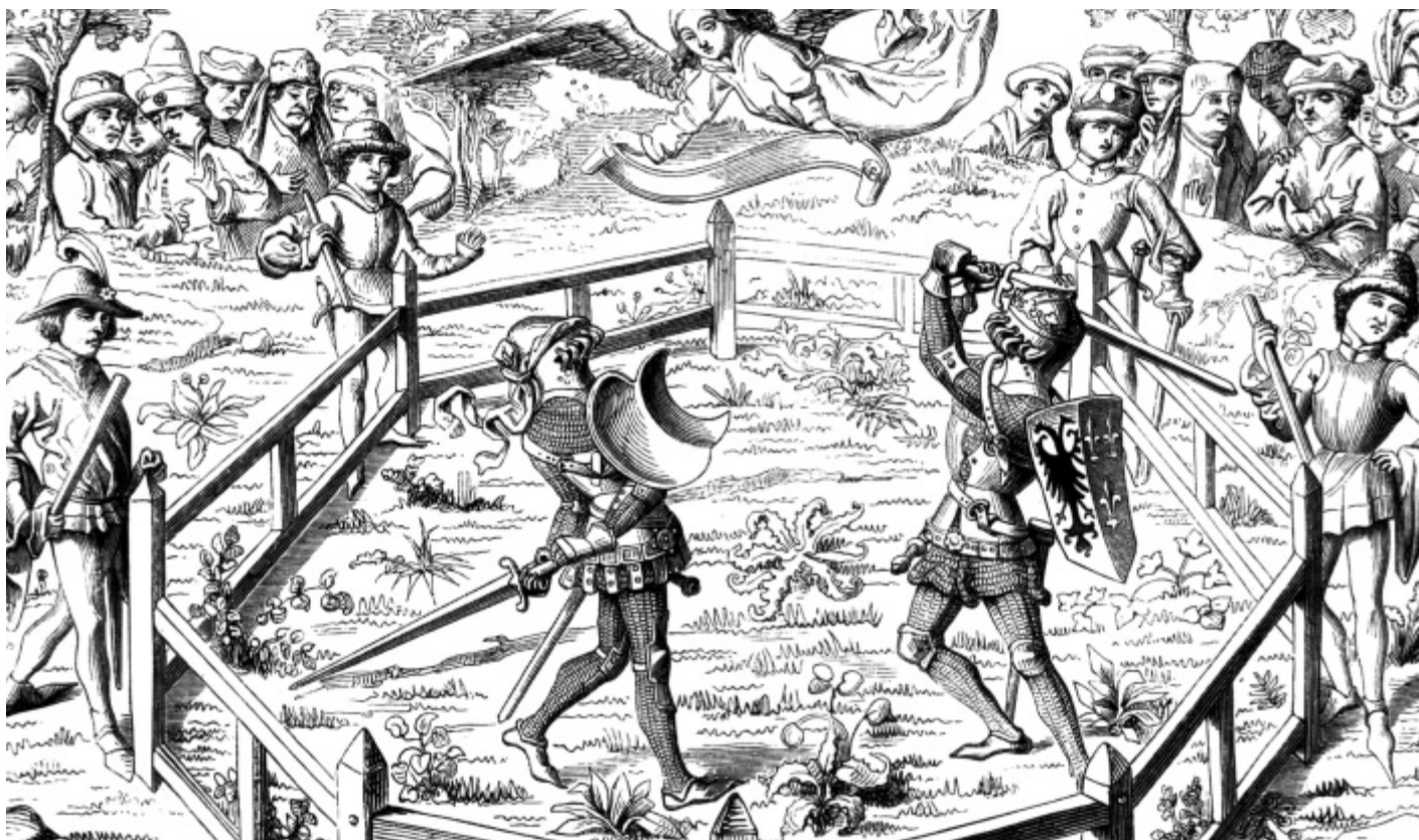
Божий суд. Гравюра XV века

Новая государственная религия молодой Европы запрещала проливать кровь. Этот нюанс сводил на нет все достижения фехтования, основная цель которого как раз таки пролитие крови. Опять же, противоречие. Кровь проливать нельзя, а драться необходимо. Парадокс, вновь потребовавший Гения. С новой идеей, новой мифологией. Почти что на уровне государственного заказа. В роли гения в этот раз выступил духовный лидер самого высокого уровня. А именно –