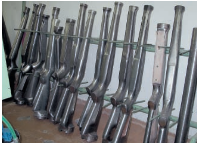
Набор шаблонов. CZ может изготавливать ложи на любой вкус

Ржип – знал, что делал. Стране с 10,3 млн. жителей можно только позавидовать такой плеяде незаурядных и талантливых изобретателей и конструкторов военного и гражданского оружия.