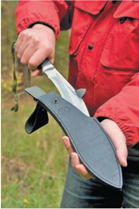
Извлечение из ножен кукри «Джунгли»

только делают нож чрезвычайно острым, но и существенно уменьшают вес. Конструктивность отработана на предыдущей модели «АиР» «Боярин». Твёрдость в пределах заявленной.