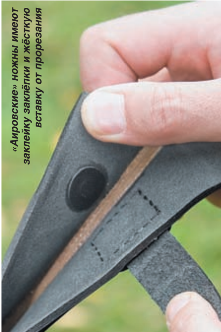
«Аировские» ножны имеют заклепку заклёпки и жёсткую вставку от прорезания