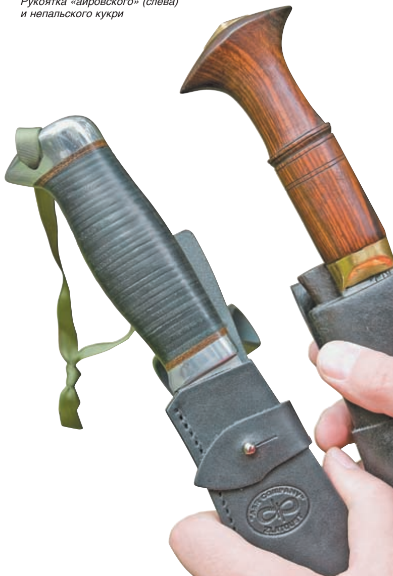
Рукоятка «айровского» (слева) и непальского кукри

Геометрия клинка классическая, напоминает своими габаритами и формой непальскую модель кукри Chainrige, но ось у нового ножа несколько выше, а в совокупности с фальшьлезвием по обуху, на 2/3 клинка, новым ножом можно без затруднения не только наносить рубящие удары, но и колющие. Общая длина – 420 мм, длина клинка – 280 мм, толщина обуха – 6,5 мм. У оригинального кукри заточка по всей длине лезвия переменная – у рукояти более острый угол, а к кончику более тупой. Также сделали и в «АиРе», но с характерным для себя почерком – линзовидно вогнутые спуски на 2/3 клинка от рукояти и прямые к концу лезвия, а также довольно широкий и глубокий дол. Такие выборки металла не