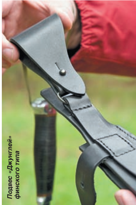
Подвес «Джунглей» финского типа