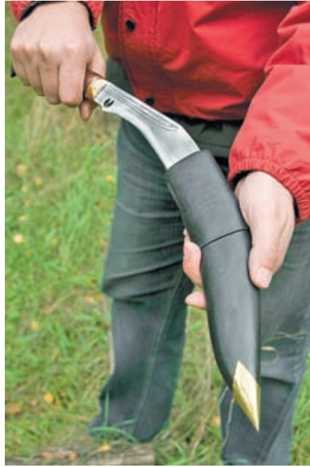
Извлечение из ножен непальского кукри

только делают нож чрезвычайно острым, но и существенно уменьшают вес. Конструктивность отработана на предыдущей модели «АиР» «Боярин». Твёрдость в пределах заявленной.