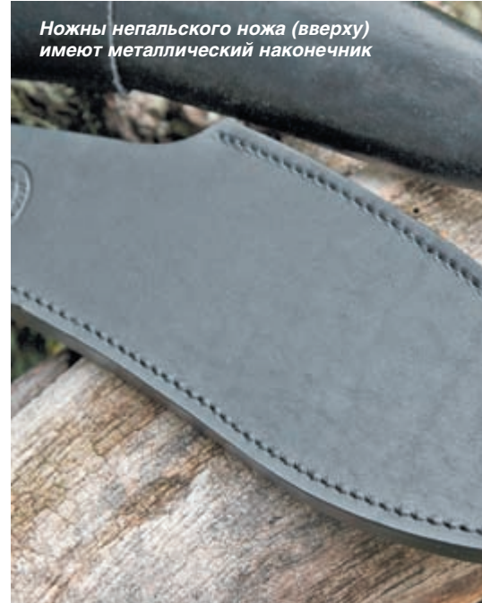
Ножны непальского ножа (вверху) имеют металлический наконечник