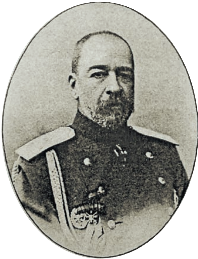
Товарищ министра внутренних дел, генерал-майор П. Д. Святополк-Мирский

о ходатайствах со стороны военного губернатора на издание этого самого постановления, может свидетельствовать о том, что решение об издании обязательного постановления военным губернатором было принято самостоятельно, исходя из сложившейся ситуации.