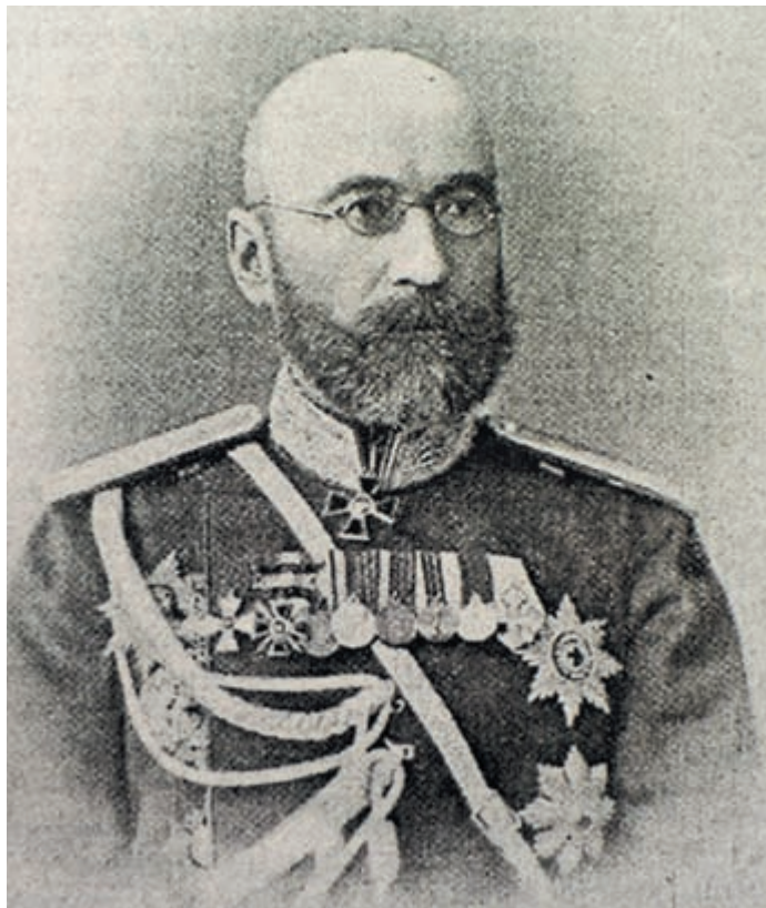
Приамурский ген.-губернатор Н. И. Гродеков

28 марта 1900 г. Приамурский ген.-губернатор Гродеков представлением № 2796 сообщил министру внутренних дел: «...Приморский военный губернатор, с своей стороны, возбудил ходатайство об издании распоряжения, чтобы продажа огнестрельного оружия как русским, так и иностранным подданным производилась не иначе как по предъявлении разрешения или удостоверения от