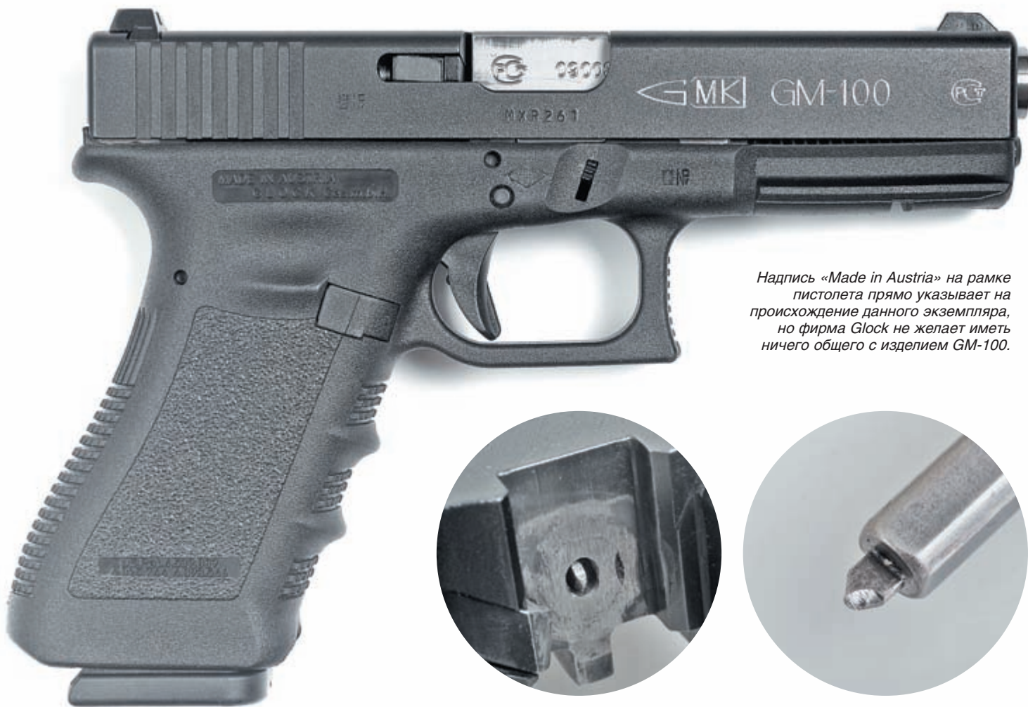
Надпись «Made in Austria» на рамке пистолета прямо указывает на происхождение данного экземпляра, но фирма Glock не желает иметь ничего общего с изделием GM-100.