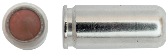
Новый 50 Дж 9-мм РА патрон с резиновой пулей