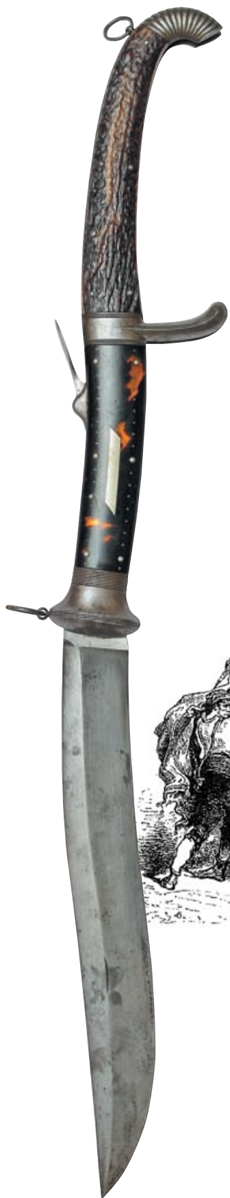
Особенность этой навахи – расположение рычага фиксатора ближе к середине рукояти, которая, в свою очередь, делится упором примерно пополам