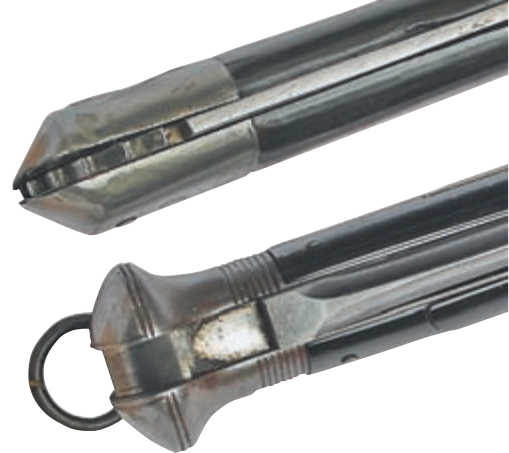
Клинок верхней навахи мог фиксироваться в промежуточных положениях, механизм нижнего ножа практически идентичен современному «линейному замку»

Другим способом добиться максимального КПД было соединение противников. В этом случае бойцы, на время боя, брали друг друга за невооружённые руки. Отпустить смертельное рукопожатие можно было