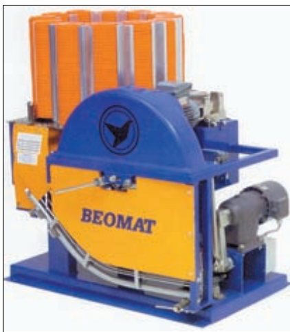
Метательная машинка Auto Rabbit («Заяц») фирмы BEOMAT, одной из ведущих мировых фирм-производителей специального оборудования для спортинга и стендовой стрельбы

Сегодня без преувеличения можно сказать – спортинг становится наиболее значимым фактором, влияющим на развитие стрелковой и охотничьей культуры России.