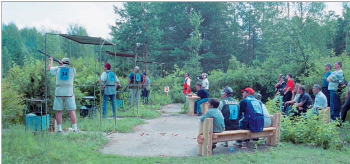
Соревнования на «Кубок Александра Невского». Типичный образец спортивной площадки. Соревнования проводятся в условиях максимально приближенных к реальной охоте. Не забыты и зрители

ет ли финн свой Fabarm на дорогомостоящее Perazzi журнал сообщит читателям в следующем номере.