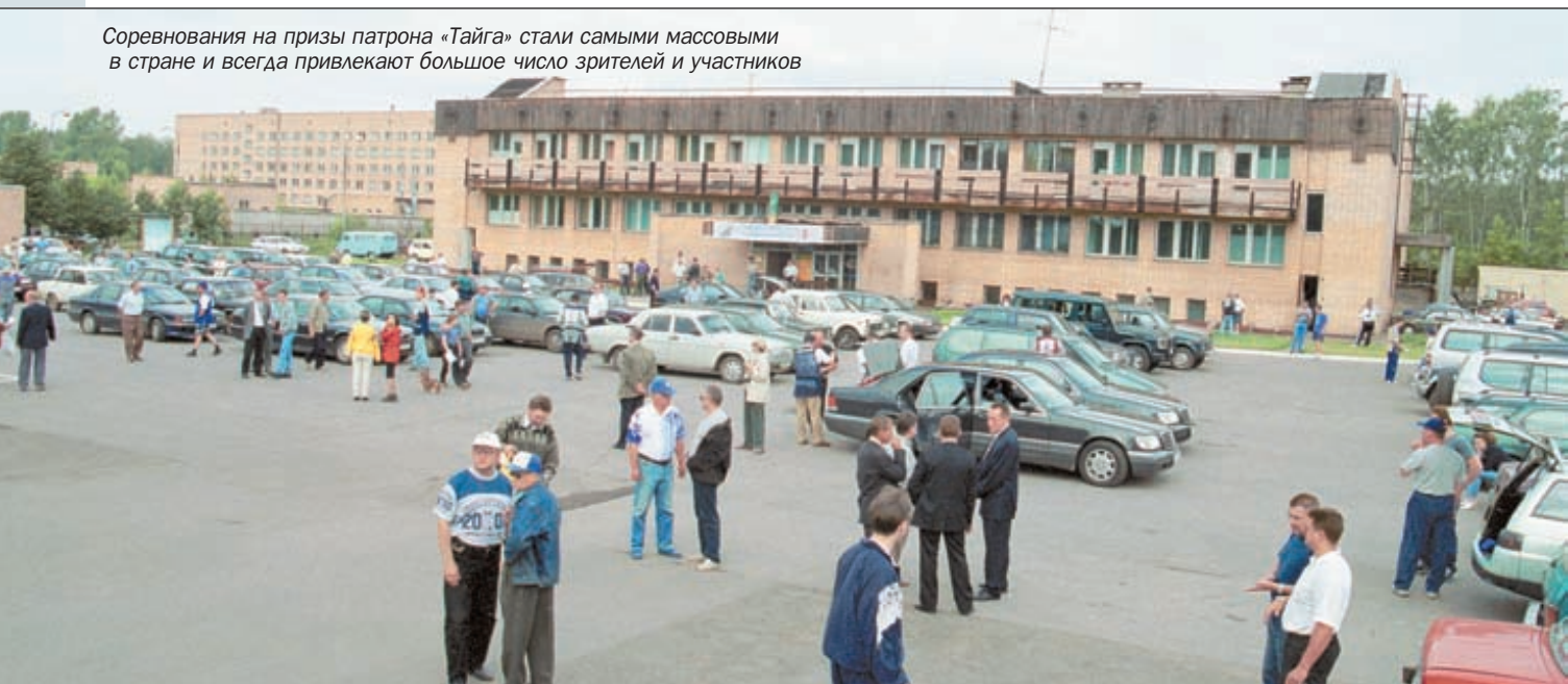
Соревнования на призы патрона «Тайга» стали самыми массовыми в стране и всегда привлекают большое число зрителей и участников

Спортивный, как один самых популярных видов спортивно-охотничьей стрельбы, является самым мощным потребителем патронов, мишеней, метательных машинок, оружия и многих других сопутствующих спортивно-охотничьих товаров. Поэтому параллельно спортивным со-