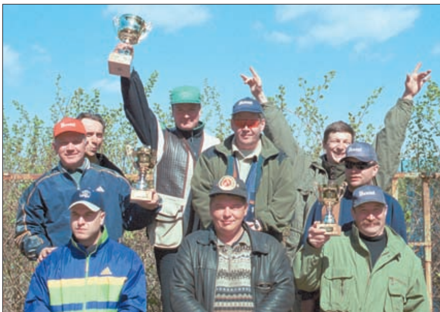
Победители в командном зачёте Открытого Кубка Санкт-Петербурга Слева-направо: 1 СОК (Москва), СОСК (Санкт-Петербург), «Русский Медведь» (Москва)