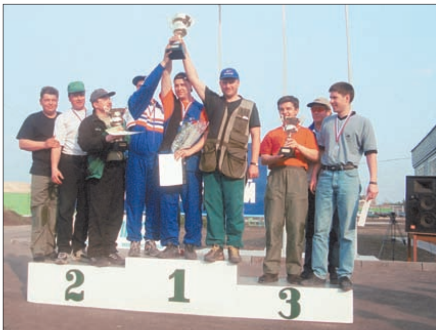
Команды-победительницы всероссийских соревнований на «Кубок Новолипецкого металлургического комбината» в упражнении компакт-спортинг, проходивших в апреле 2000 г. Первое место заняли москвичи из клуба «Русский спортинг», второе и третье – команды Санкт-Петербургского стрелково-охотничьего клуба

Спортивный календарь всероссийских соревнований этого года был как никогда насыщен. Во всех регионах, где спортинг активно развивается прошли открытые кубки и чемпионаты. Это Мурманск, Липецк, Санкт-Петербург, Москва. Но апогеем, безусловно, стали Кубок и Чемпионат России, которые состоялись в Москве. Причём Кубок проводился впервые, а Чемпионат 2000 года стал уже вторым в истории российского спортинга. В них приняли