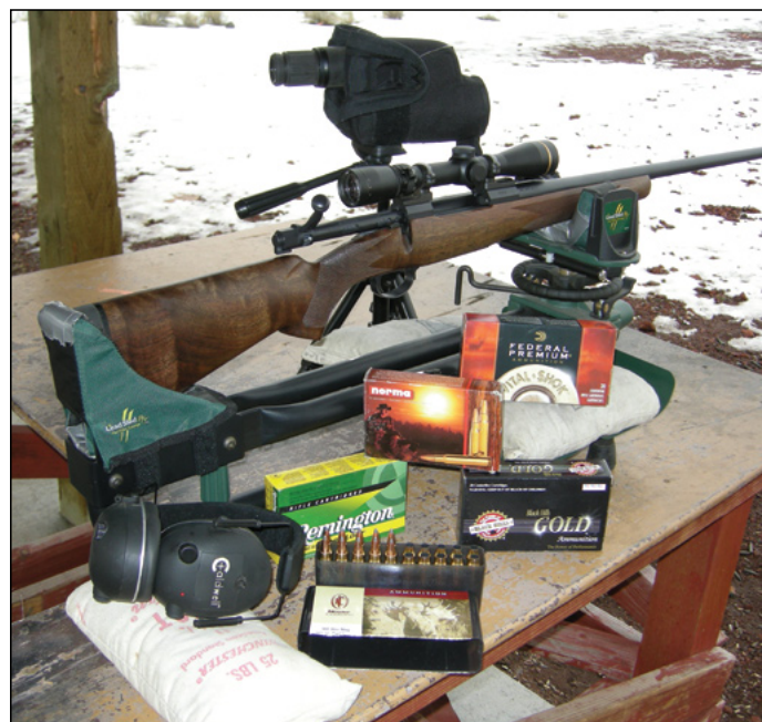
Винтовка Nosler Model 48 Legacy является четвертой в серии Model 48 и проектировалась, как превосходное охотничье оружие.