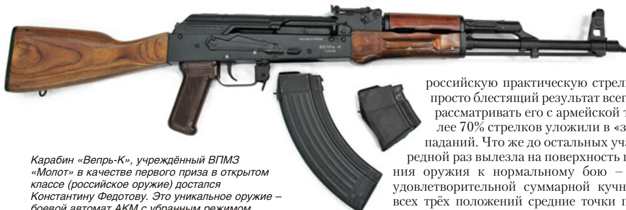
Карбин «Вепрь-К», учреждённый ВПМЗ «Молот» в качестве первого приза в открытом классе (российское оружие) достался Константину Федотову. Это уникальное оружие – боевой автомат АКМ с убраным режимом автоматического огня