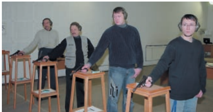
Отдых стрелка возможен и с упором пистолета о столик. Указательный палец находится на предохранительной скобе или на рукоятке