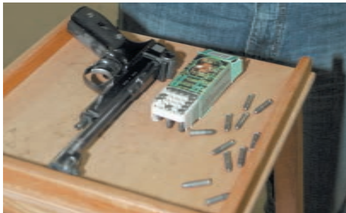
Закончив серию из пяти выстрелов, стрелок кладёт оружие на столик и снаряжает магазин патронами для следующей серии