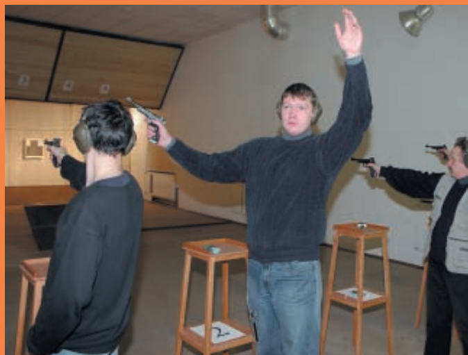
Категорически запрещается разворачивать руку с оружием вдоль линии огня

чуть ли не обычным делом. При этом объяснения как бы и не требовались, оказывалось достаточно подойти к нарушителю и строго взглянуть в глаза «бывалому» стрелку.