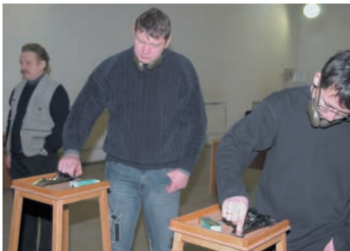
Вносить поправки в прицел, и вообще трогать оружие в перерывах между сериями, когда у мишеней находятся люди – преступление

Наблюдения показали, что динамика нарушения мер безопасности также имеет свои закономерности в зависимости от времени обучения. Оказалось, что количество предпосылок к опасным ситуациям особенно интенсивно возрастает от первого до третьего занятия (от 15,3 % до 26,8 %), удерживается примерно на одном уровне до 8 занятия, затем постепенно снижается и к 13-15 занятиям составляют не более 3-5 % от их общего числа за курс обучения. Аварийные ситуации (непреднамеренные выстрелы в пол и потолок огневой зоны тира) были отмечены на 2-5 занятиях.