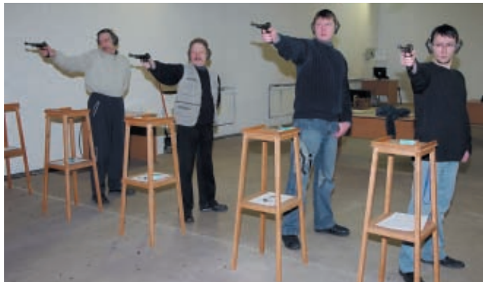
Смена ведёт стрельбу из пистолета

Из практики известно, что опасные ситуации при стрельбе чаще возникают в течение двух периодов занятий ею – на начальном этапе усвоения техники стрельбы, когда у молодого стрелка еще не сформирована модель безопасного стрелкового поведения, и в дальнейшем, когда человек, часто занимаясь этой опасной деятельностью, адаптируется, привыкает к ней и перестаёт считать её опасной. К сожалению или к счастью, трудно сказать, но мне эти ситуации очень хорошо знакомы. За многие годы преподавания стрелкового спорта на кафедре спортивного вуза случалось всякое, и если на общем курсе, где курсанты начинали изучать азы спортивной пулевой и стендовой стрельбы, непреднамеренный выстрел в сторону мишеней и стрелком и руководителем всегда расценивался как чрезвычайное происшествие с подробным разбирательством и «оргвыводами» (перевод на какое-то время на холостую стрельбу, без патронов), то на занятиях с контингентом слушателей факультета подготовки тренеров высшей квалификации, мастерами спорта и МСМК, то же ЧП – случайный выстрел в сторону мишеней считался