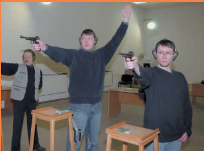
О возникшей задержке в стрельбе стрелок сообщает руководителю голосом и поднятием свободной руки вверх