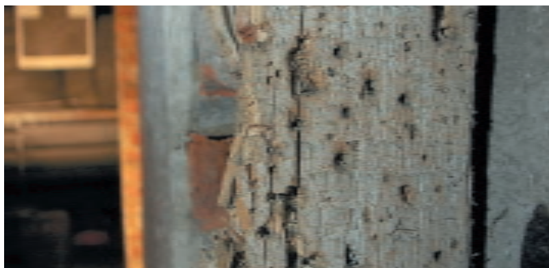
Так выглядит оборудование тира при его интенсивном использовании. Непроизвольно выпущенные пули всегда находят свои «цели»

Анализ причин возникновения случаев опасного поведения и нарушения мер безопасности проводился по нескольким адаптированным методикам исследования личности в условиях деятельности повышенной опасности. Полученные данные чаще всего свидетельствуют о том, что эти причины носят психогенный характер, зависят от черт личности, характера, темперамента, степени эмоционального напряжения при стрельбе, возникающего от новизны обстановки первых занятий и др. Была выявлена также некоторая взаимосвязь между безопасным поведением обучаемых и их честолюбием, чувством долга, ответственностью, дисциплинированностью.