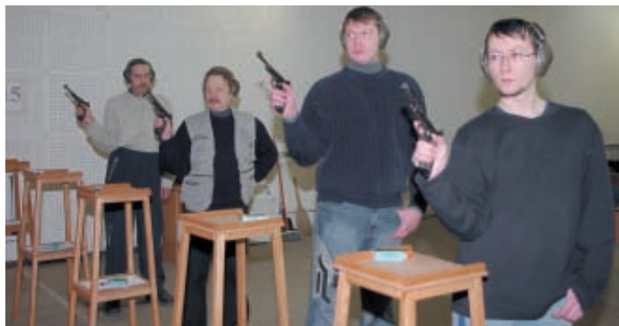
Положение руки с оружием во время отдыха стрелка между выстрелами