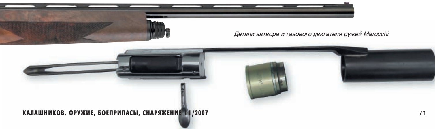
Детали затвора и газового двигателя ружей Marocchi