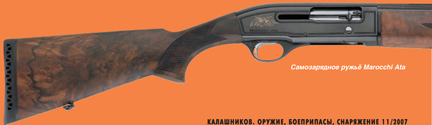
Самозарядное ружьё Marocchi Ata