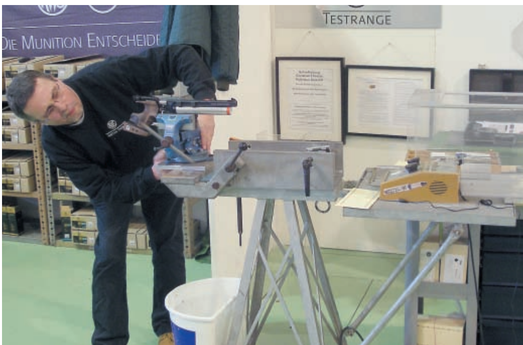
На стенде фирмы RWS можно было подобрать пули различных весов и калибров под конкретное оружие. Для этого был установлен специальный отстрелочный станок и тоннель