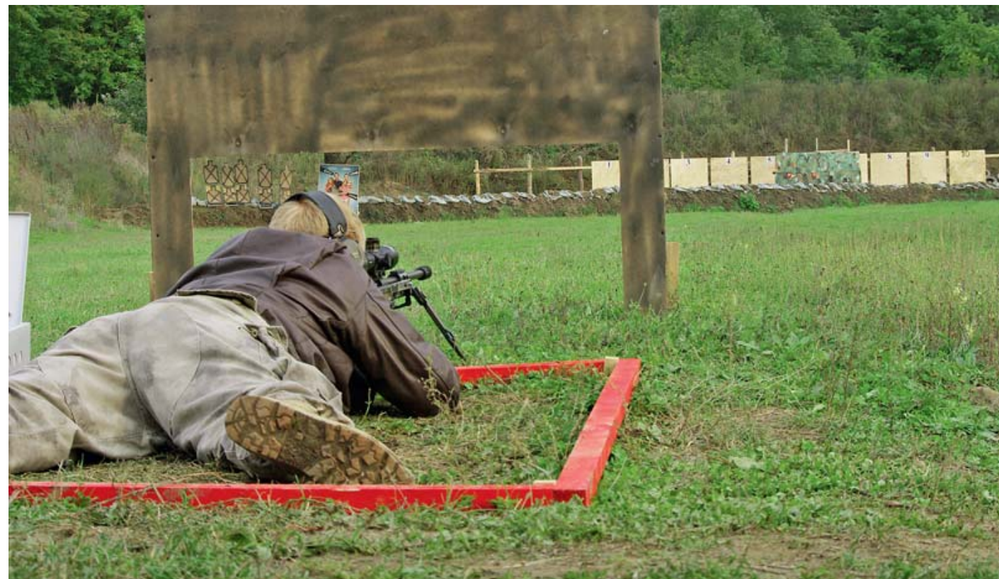
Подвижный щит с мишенями прошёл чуть больше половины расстояния, а три из пяти тарелок уже разбиты

При описании любых соревнований, в том числе и снайперских, основное внимание уделяется их участникам и тренерам (в данном случае руководителям команд), а работа судей и обслуживающих бригад и служб остается, как правило, в тени, что объяснимо, но не справедливо. Ведь судьи ничуть не меньше,