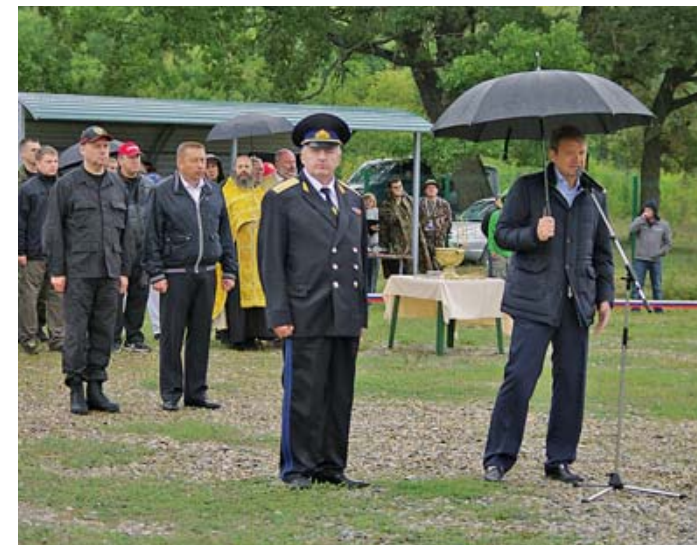
На открытие X Международных соревнований снайперских пар подразделений специального назначения памяти Виктора Лисовского прилетел губернатор Краснодарского края Александр Ткачёв

Дебютировавшая на IX соревнованиях с «показательной программой» отечественная винтовка Т-5000 в этом году демонстрировала уже «обязательную программу» сразу в нескольких командах, причём у одного стрелка из Краснодарского края «орсисовское» железо (помоему, под .308 Win.) было уложено в лоду от AW. Волей-неволей я услышал разные отзывы об этой сравнительно новой винтовке, но приводить их в статье