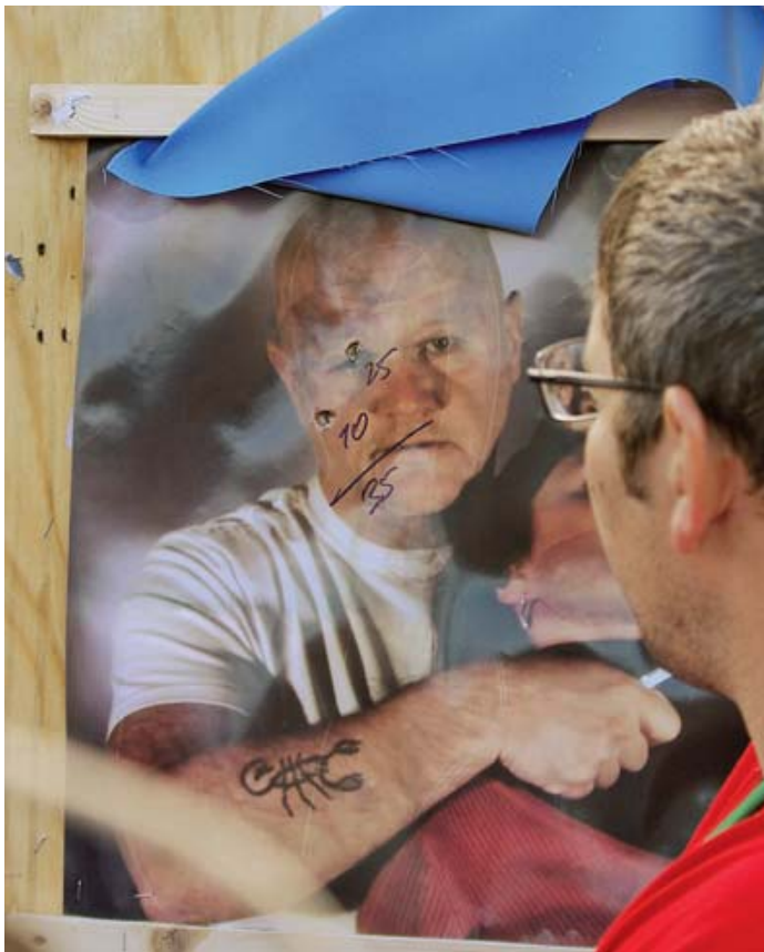
Отдёрнув занавеску, судья показывает, что террористу преподнесен хороший «сюрприз» в виде двух дырок в голове

а может быть и больше других находятся в поле (в эти дни под дождём), и часто до глубокой ночи работают с протоколами, где недопустима ни одна ошибка. Персонал общепита должен обеспечить горячий завтрак к подъёму участников, так что у него своя СБРС (специфика бесперебойной работы столовой). Комендантская служба (ну если и ошибся, то с названием, а не по сути) своевременно встречает и отправляет всех приехавших, чтобы не дай бог не опоздали на самолет или поезд, плюс решает ещё много разных проблем. Ну, а организация ввоза иностранными участниками своего оружия и боеприпасов на территорию России для меня вообще представляется чем-то запретным. Так что возьму на себя смелость от имени всех участников и гостей выразить огромную благодарность всем, кто обеспечил проведение X Международных.