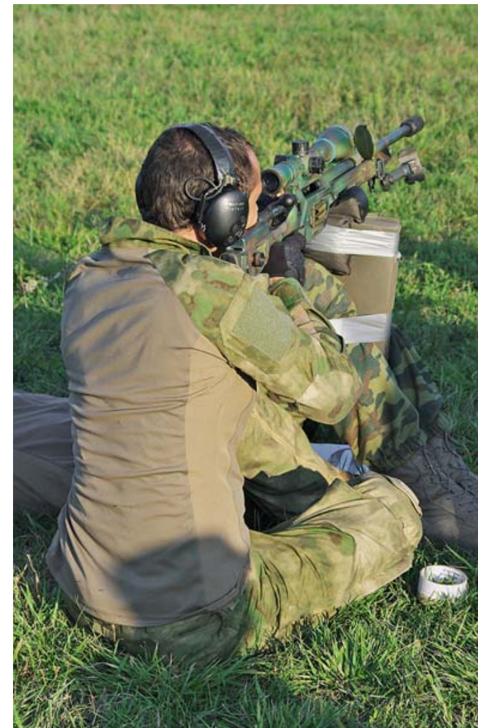
В «камасутре» помимо напарника можно было использовать и неодушевлённые предметы