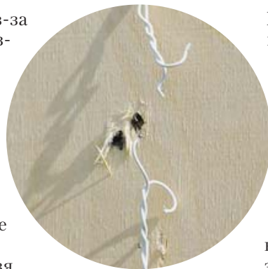
Оба провода перебиты – «фугас» не взорвался

Представители компаний «Инфратех» и «Дедал-НВ» рассказали о своих перспективных разработках и серийной продукции, часть которой выпускается только по специальному заказу. Естественно, возникли вопросы, касавшиеся и технической стороны дела, и коммерции, поскольку многим участникам соревнований приходится часть снаряжения покупать на собственные средства. Из разговоров «под дубом» у меня сложилось впечатление, что большая стоимость отечественных изделий по сравнению с иностранными компенсируется техническими решениями, заложенными в них, но насколько привлекательно или просто приемлемо сложившееся соотношение технического уровня и цены, решать самим стрелкам.