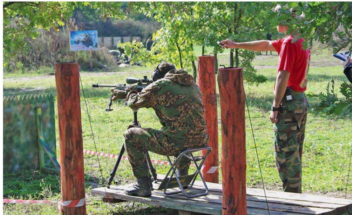
Стул и тренога превращали «лодку» в сравнительно комфортабельный «катер»

или ближайшем Подмосковье, но, может быть, дело не только в трафике, а ещё в чём-то другом?