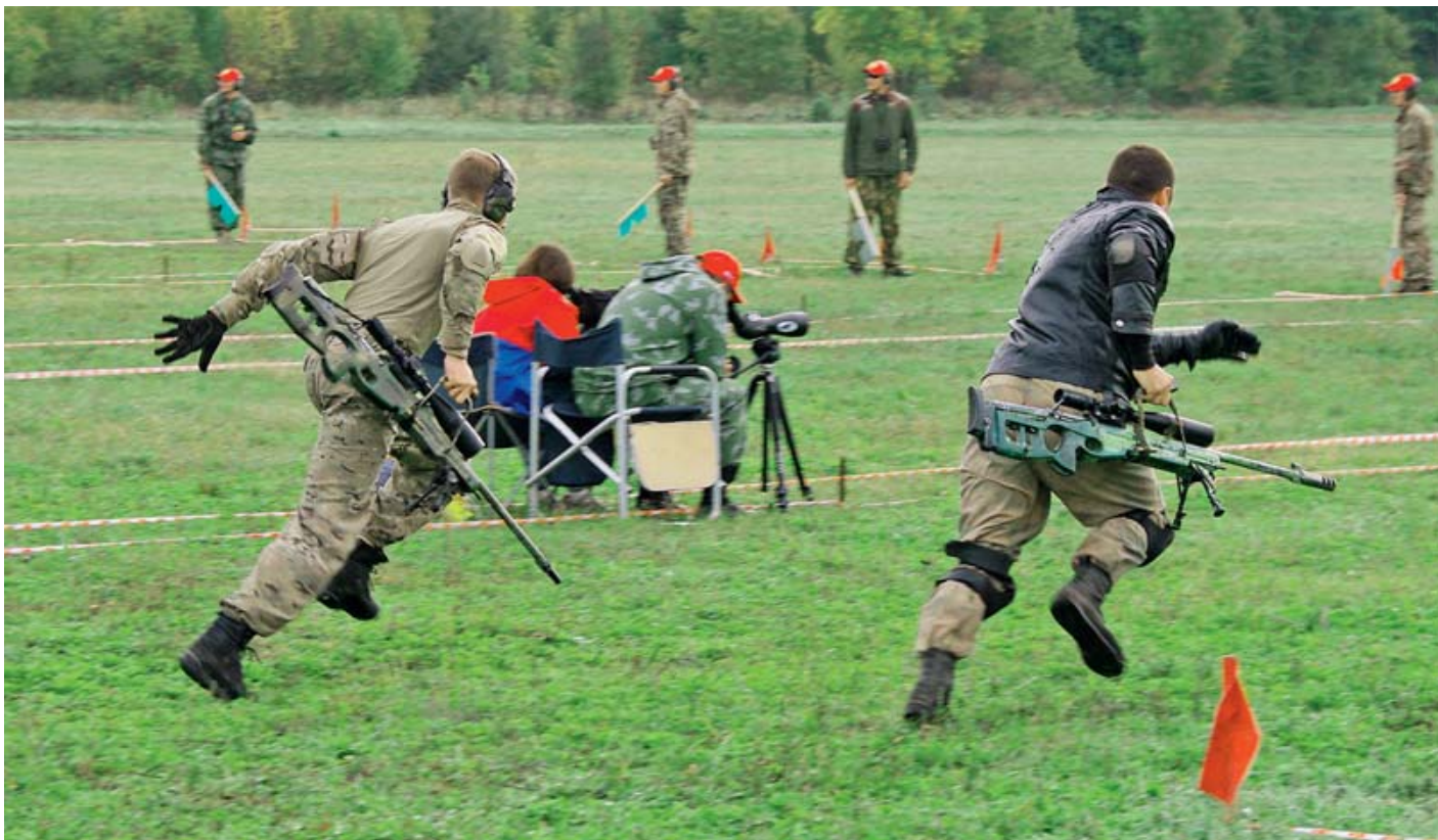
Снайперская дуэль требует не только меткой стрельбы, но и навыков спринтера