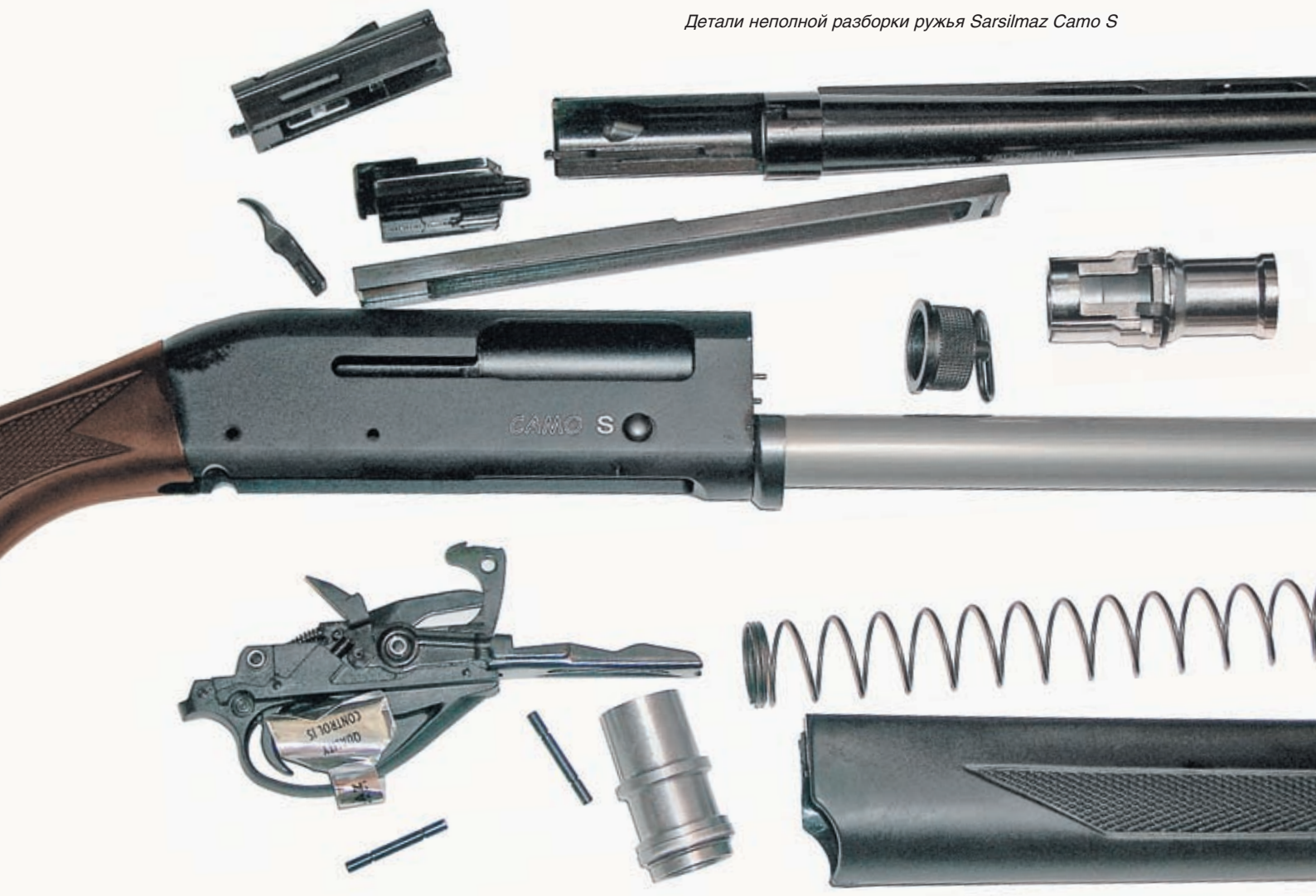
Детали неполной разборки ружья Sarsilmaz Camo S