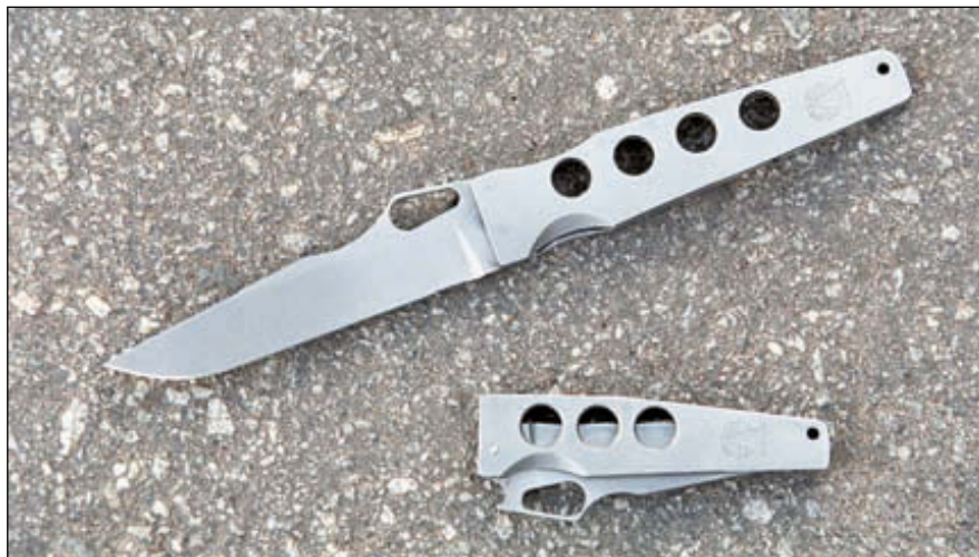
Любители холодного оружия наверняка обратили внимание на складные ножи конструкции ижевчанина Анатолия Уракова, показанные на выставке. В дальнейшем журнал «Калашников» непременно расскажет об истории создания этих ножей

Барнаулский станкостроительный завод постоянно расширяет номенклатуру выпускаемых боеприпасов. Например, три месяца назад начато серийное производство патронов для нарезного оружия некоторых калибров с оцинкованной гильзой