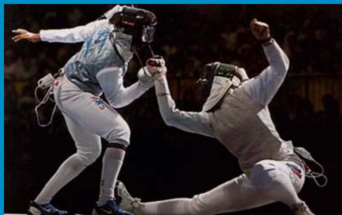
В спортивном фехтовании условность поражения обуславливала появление новых подходов к технике

случаях речь идёт о школах, имеющих отчётливую идейную ориентацию на традицию и потенциальную практическую применимость со всеми необходимыми слагаемыми традиционной боевой культуры. И что характерно – во всех (без исключения!) странах именно такие дисциплины сейчас находятся на подъёме, привлекая к себе всё больше адептов, расширяя своё влияние вплоть до проведения тематических международных симпозиумов.