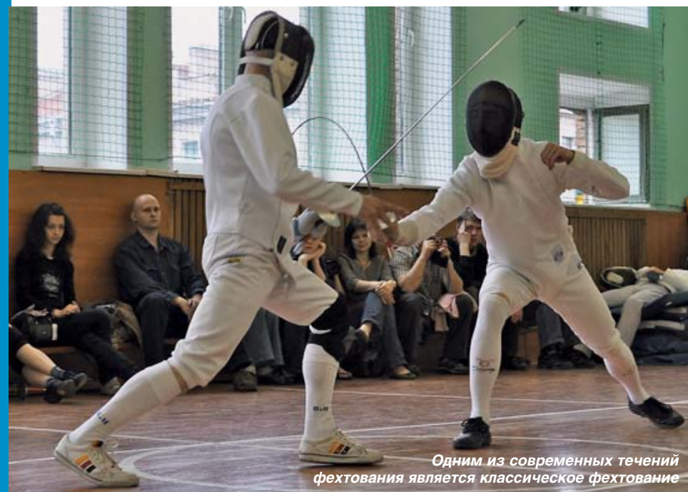
Одним из современных течений фехтования является классическое фехтование