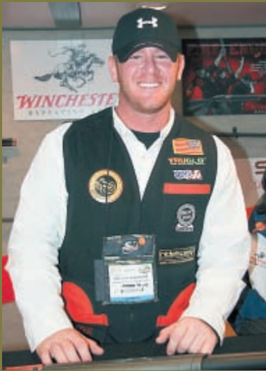
Стрелок-виртуоз Патрик Фланниган выглядит вполне довольным жизнью. Здесь его стихия

которой в Голливуде тамошние сценаристы ещё только пишут.