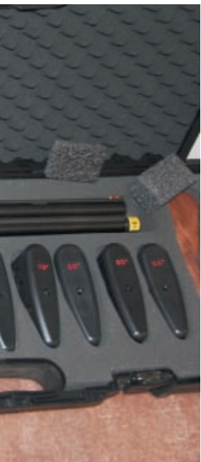
Blaser F3 со специальным прикладом для снятия со стрелка размеров, необходимых для изготовления ложи по индивидуальному заказу

Камуфляж. Здесь его царство. Камуфлируется всё – от джипа, до туалетной бумаги. Ножики, фонарики, ложки, сошки, пистолеты, детские комбинезоны и бюстгальтеры любимых женщин. Один раз уронив в траву или прислонив к дереву, есть хороший шанс не найти