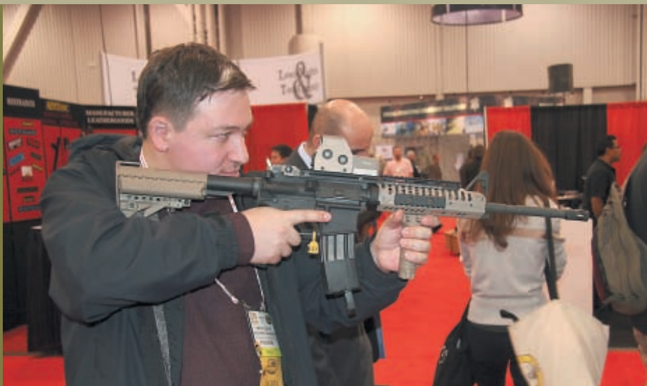
Автор статьи с легендарной «чёрной винтовкой» в руках