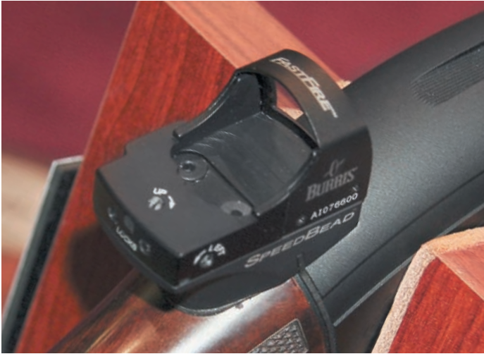
Новинка от Burris – мини-кронштейн, который устанавливается вместо прокладки между прикладом и ствольной коробкой и позволяет установить на ружьё компактный коллиматорный прицел

Увы, увы. Оружие дело мужское и женщин не допускали. Лишь единицы из них давали взору отдохнуть от бескончаемых рядов оружия. Вот очень стройная девушка из последних сил старается удержать в руках не менее стройную, но очень тяжёлую, снайперскую винтовку.