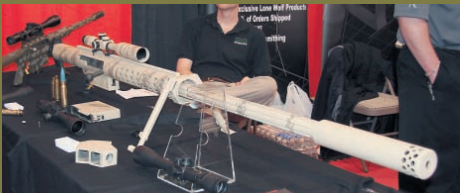
Крупнокалиберная экзотика – 20-мм образец. Практически это уже малокалиберная артиллерия