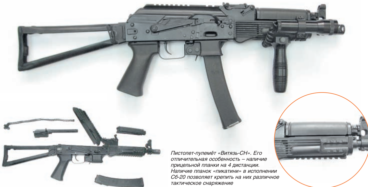
Пистолет-пулемёт «Витязь-СН». Его отличительная особенность – наличие прицельной планки на 4 дистанции. Наличие планок «пикатини» в исполнении Сб-20 позволяет крепить на них различное тактическое снаряжение

В итоге работы появились два варианта ПП: один на базе автомата АКС74У, получивший название «Витязь», второй, на базе «сотой» серии – «Витязь-СН». Основным патроном для «Витязя» является 9x19 ПРС – патрон с пониженной рикошетирующей способностью. Он имеет оболочечную пулю со свинцовым сердечником. Вместе с тем для стрельбы можно использовать как патроны 9x19 с пулей повышенной пробиваемости (7Н21), так и другие типы патронов 9x19 отечественного и иностранного производства.