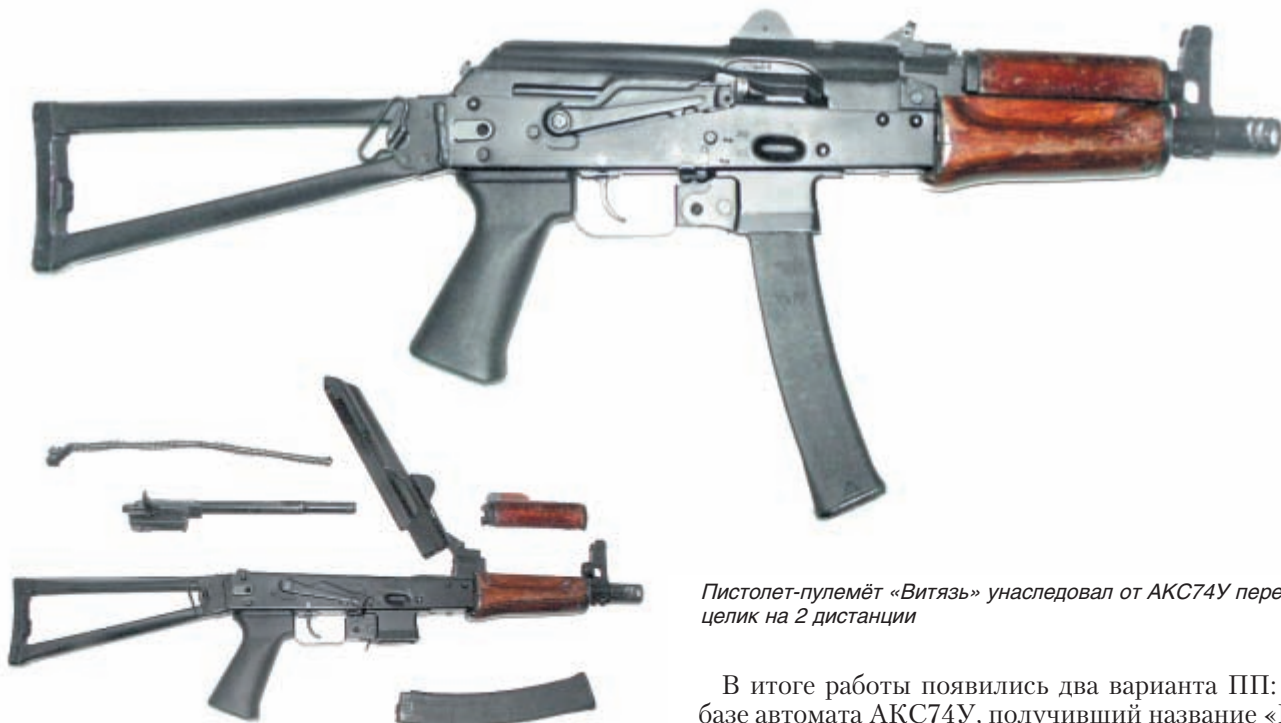
Пистолет-пулемёт «Витязь» унаследовал от АКС74У перекидной целик на 2 дистанции

пистолету-пулемёту. Первоначально предполагалось изготовление ПП путём переделки имеющихся на вооружении МВД автоматов АКС74У под пистолетный патрон 9x19. В процессе работы тема получила дальнейшее развитие и техническое задание было дополнено в части разработки второго варианта ПП на базе автоматов АК «сотой» серии.