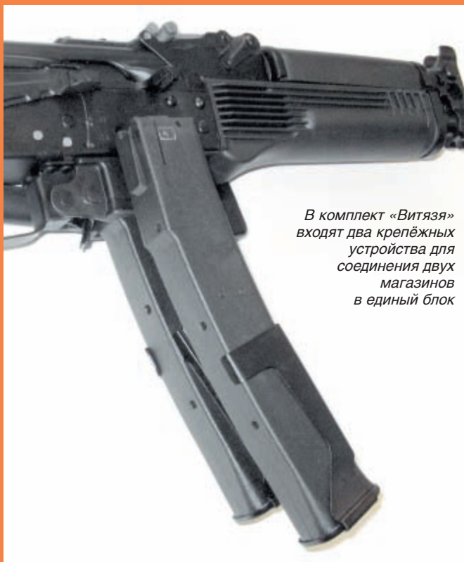
В комплект «Витязя» входят два крепёжных устройства для соединения двух магазинов в единый блок

Автоматика обоих ПП имеет общую схему и основана на принципе отдачи свободного затвора. По конструкции затвор «Витязя» аналогичен затвору ПП «Бизон-2». Отличаются они только размерами досылателя (так как, в отличие от магазина «Бизона» с однорядным выходом патронов, магазин «Витязя» двухрядный с шахматным расположением патронов) и расположением рукоятки перезарядки. Рукоятка перезарядки сдвинута вперёд, а вырез для неё в крышке ствольной коробки полностью закрывается щитком переводчика, что позволило надёжно прикрыть затвор и ударно-спусковой механизм от загрязнения.