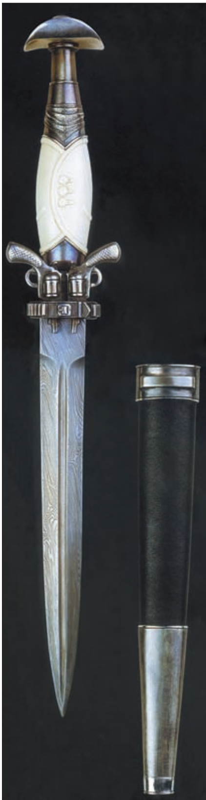
Нож «Ковбой VII» из серии «Великолепная семёрка»

вые требования и к оружейному заводу, и к художнику-оружейнику, который хочет работать индивидуально (подробнее этот вопрос затронут в материале «Нож в законе» «Калашников» № 3/2000). А в некоторых развитых и демократических странах мастера, достигшие наибольших успехов на этом поприще, признаются национальным достоянием.