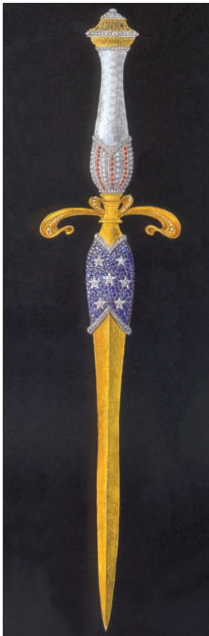
Кинжал «Америка». В оформлении использованы бриллианты, сапфиры и рубины. Длина клинка 200 мм

В настоящее время в России появились люди дела, имеющие не только желание, но и возможность жить сообразно своим запросам. Именно в их среде начинают появляться знатоки и ценители, а главное, заказчики элитного холодного