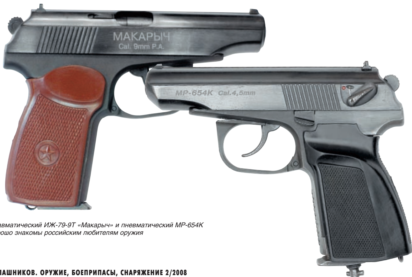
Травматический ИЖ-79-9Т «Макарыч» и пневматический МР-654К хорошо знакомы российским любителям оружия