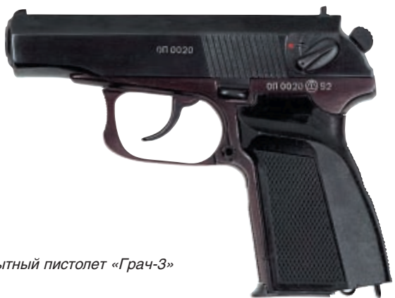
Опытный пистолет «Грач-3»

о проведении в рамках этой работы модернизации пистолета Макарова. Это давало возможность достаточно быстро (в пределах 2-3 лет) обеспечить армию оружием самообороны, характеристики которого были бы максимально приближены к уровню современных образцов. Тем более, что проработки проекта модернизации пистолета Макарова велись ещё в 1970-е годы. Работу поддерживал курировавший в ЦК КПСС оборонную промышленность Д. Ф. Устинов. В те времена были опробованы и идея увеличения мощности 9-мм пистолетного патрона в тех же габаритах, и идея торможения отката затвора за счёт деформации гильзы в канавки. Испытания показали, что при этом пистолет надёжно работает как на усиленном, так и стандартном патроне. Однако в то время армией ещё не была осознана необходимость перевооружения новым пистолетом. Работа закончилась на стадии предварительных испытаний.