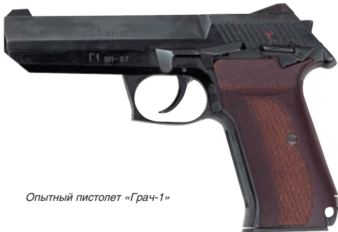
Опытный пистолет «Грач-1»