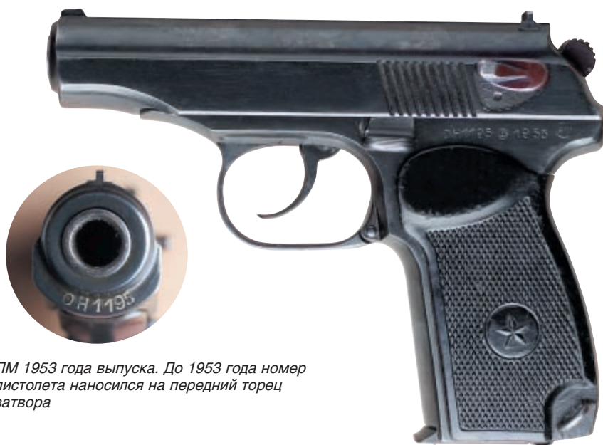
ПМ 1953 года выпуска. До 1953 года номер пистолета наносился на передний торец затвора