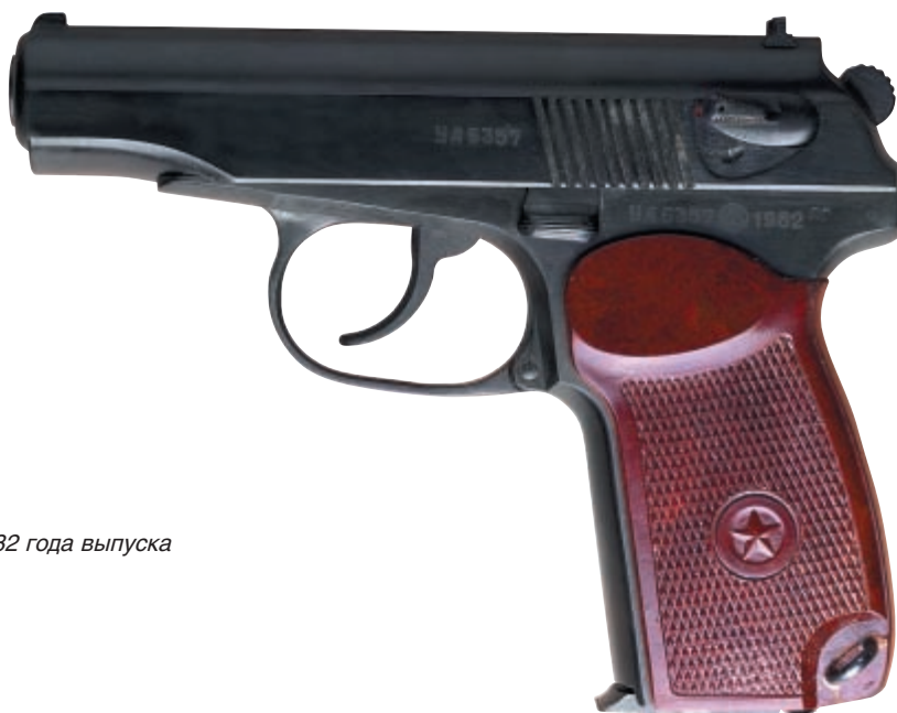
ПМ 1982 года выпуска