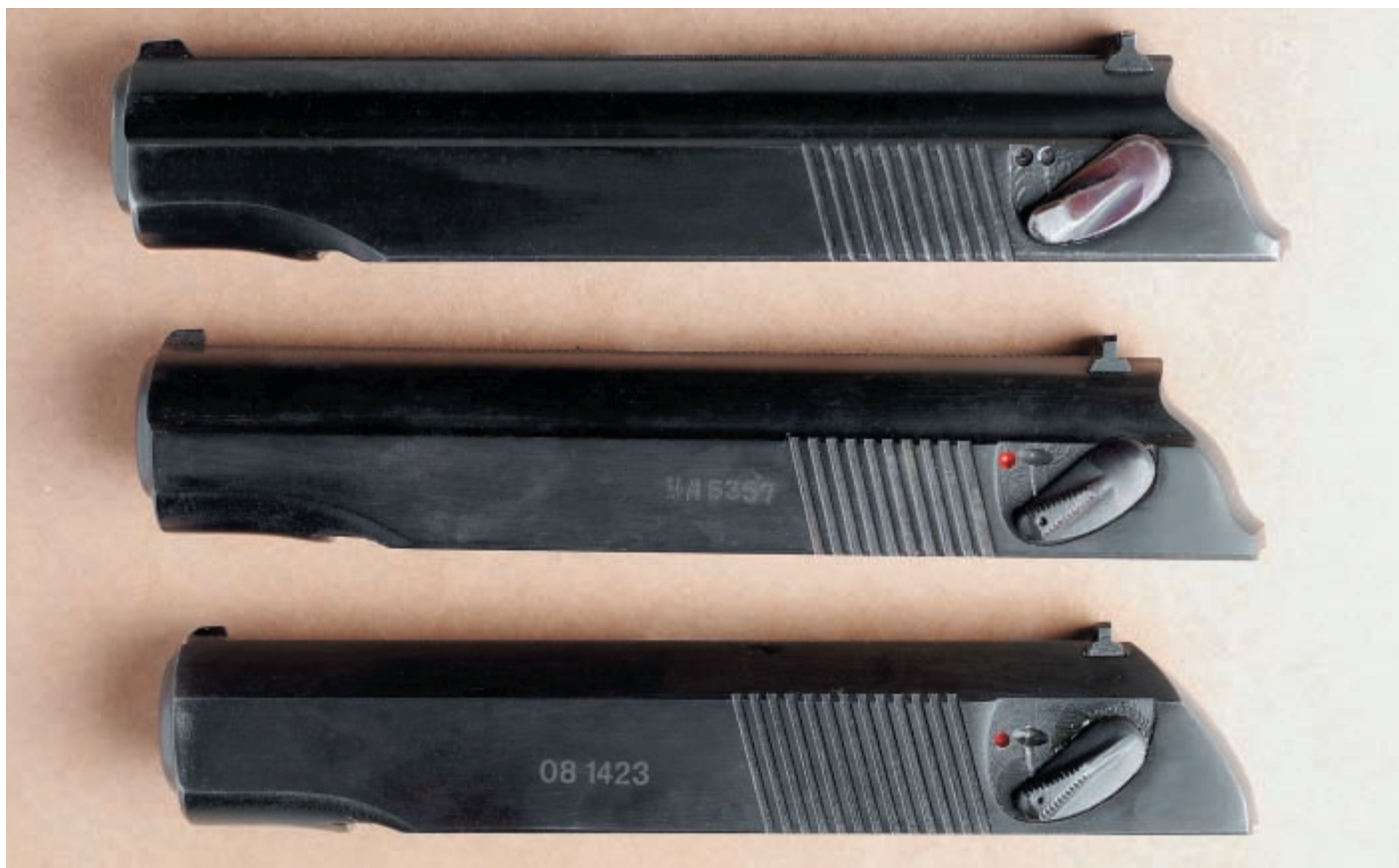
Сверху вниз: затворы пистолетов ПМ 1953, 1982 годов выпуска и затвор пистолета ПММ 1995 года выпуска. Обратите внимание на различия формы флажка предохранителя у пистолетов ПМ. Затвор ПММ легко отличить от затвора ПМ по наличию граней на его верхней части, характерной форме задней части и более массивному виду в целом

Это сейчас специалисты завода вспоминают как курьёз появившуюся в те годы в отраслевом журнале статью, автор которой, проанализировав уровень технологичности пистолета Макарова, оценил его как эталон нетехнологичной конструкции и предрёк неудачу с постановкой его на