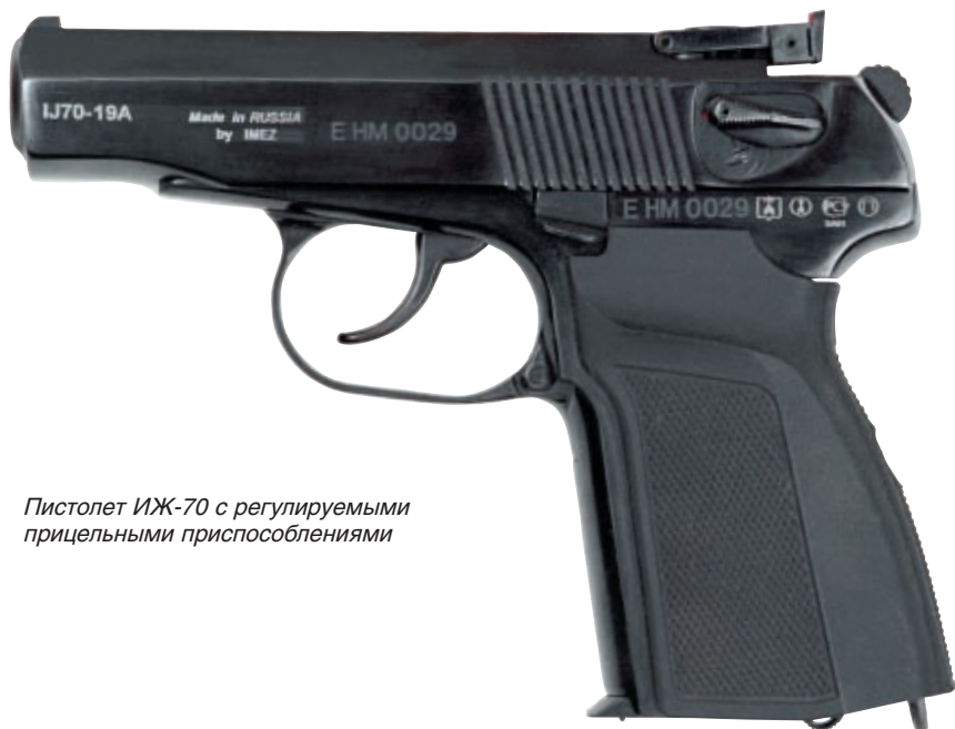
Пистолет ИЖ-70 с регулируемыми прицельными приспособлениями