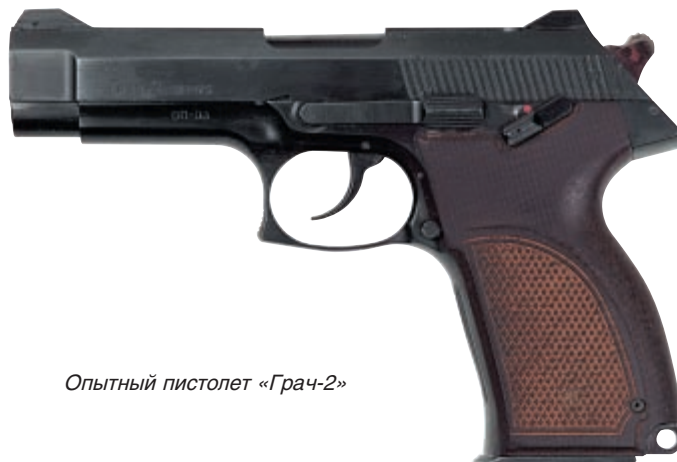
Опытный пистолет «Грач-2»

К началу 60-х годов пистолет Макарова производился в условиях массового производства. Качество соответствовало требованиям конструкторской документации, но как количество, так и качество доставались дорогой ценой. Для того времени считался нормальным 30-процентный возврат на ремонт с предъявительских испытаний стрельбой. Отходил в брак каждый пятый магазин, ежегодно списывался в брак двухмесячный объём выпуска рамки. Работа по совершенствованию конструкции и технологии изготовления пистолета велась непрерывно, в течение десятилетий.