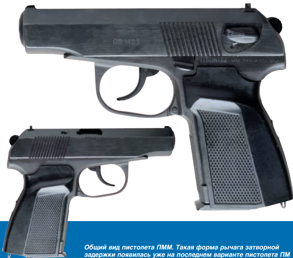
Общий вид пистолета ПММ. Такая форма рычага затворной задержки появилась уже на последнем варианте пистолета ПМ

Перед конструкторами стояла задача, сохранив предельно производственную базу и положительные качества