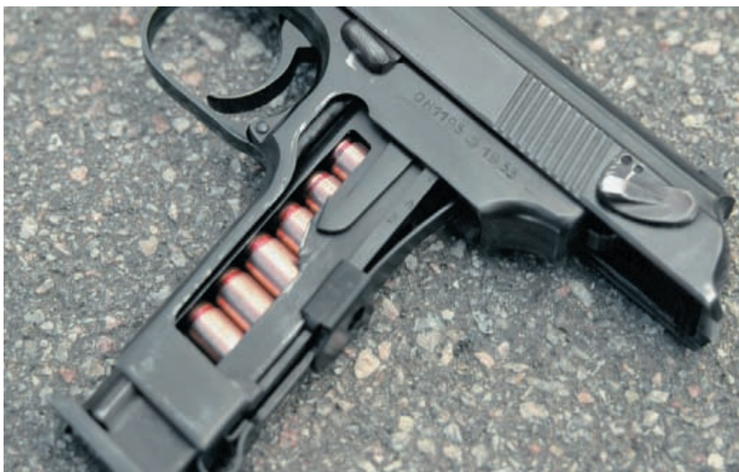
Магазины пистолетов ПМ разных годов выпуска. До 1953 года магазин (1) имел хвостовик, взаимодействовавший с нижним рычагом затворной задержки (см. фото внизу). В 1953 году он был «аннулирован» (2), а к середине 80-х годов выдавка под выступ подавателя была заменена пазом (3)

причиной большого количества задержек. В 1953 г. хвостовик был «аннулирован». Введена дополнительная фиксация боевой пружины на рамке задвижкой. Сделаны более мощными спусковая тяга и предохранительная скоба. Введено хромирование поверхности канала ствола.