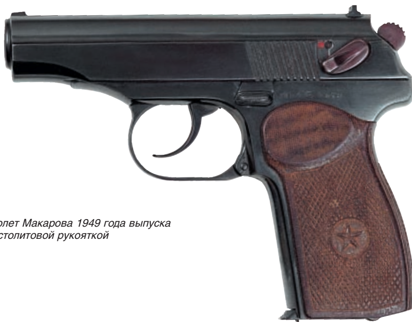
Пистолет Макарова 1949 года выпуска с текстолитовой рукояткой