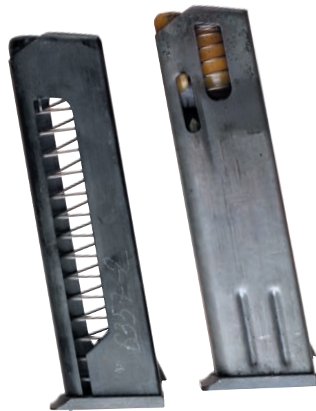
Магазины пистолетов ПМ (слева) и ПММ