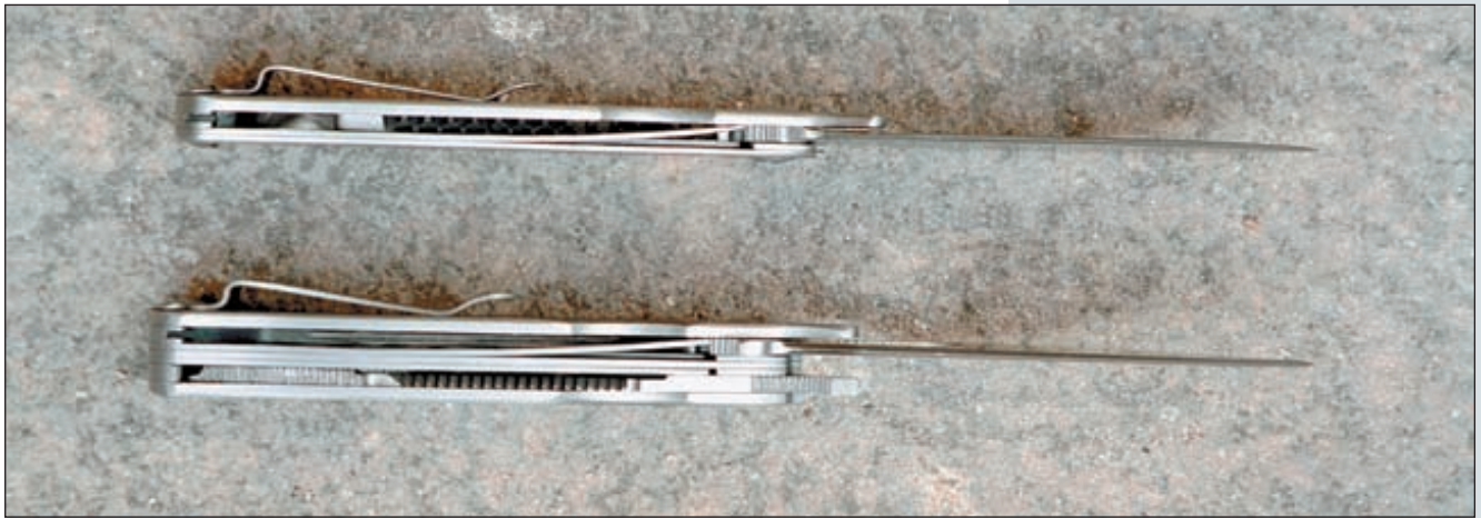
«Оса-2» на 4 мм толще и несколько тяжелее «Оса-С» – это плата за универсальность

мане. Также нож можно носить на поясе в специальном кожаном чехле. При этом чехол может закрепляться горизонтально (на узких ремнях) или вертикально (на узких и широких ремнях).