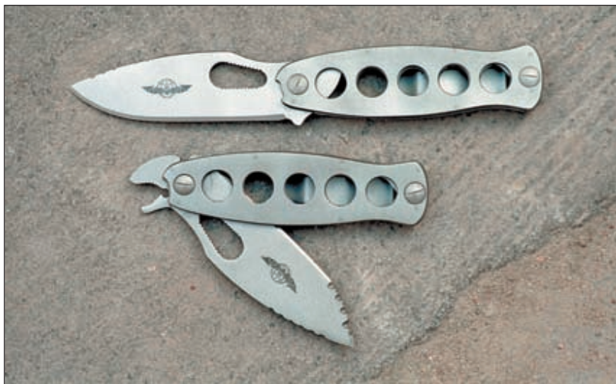
«Оса-С» с клинком, зафиксированным в рабочем положении и кусачки ножа «Оса-С»

«Оса-С» комплектуется вертикальными поясными ножнами, ножны ножа «Оса-Командос» наиболее универсальны и позволяют носить даже рукояткой вниз, «Оса-2» носится на поясе в ножнах, которые легко прятать за чехол мобильного телефона