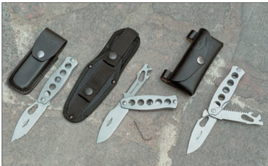
Слева-направо: «Оса-С», «Оса-Командос», «Оса-2».

Инструментальный клинок имеет высокую функциональную насыщенность. В нём есть пила по дереву (ей можно перепилить дерево диаметром до 50 мм), пила по металлу, консервный нож, плоская отвёртка, гаечный ключ, гвоздодёр и линейка. Кроме того, на рукоятке расположен выступ, который при его использовании совместно с инструментальным клинком играет роль кусачек и некоего подобия пассатижей (при боевом использовании можно