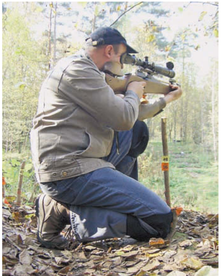
Изготовка «с колена»