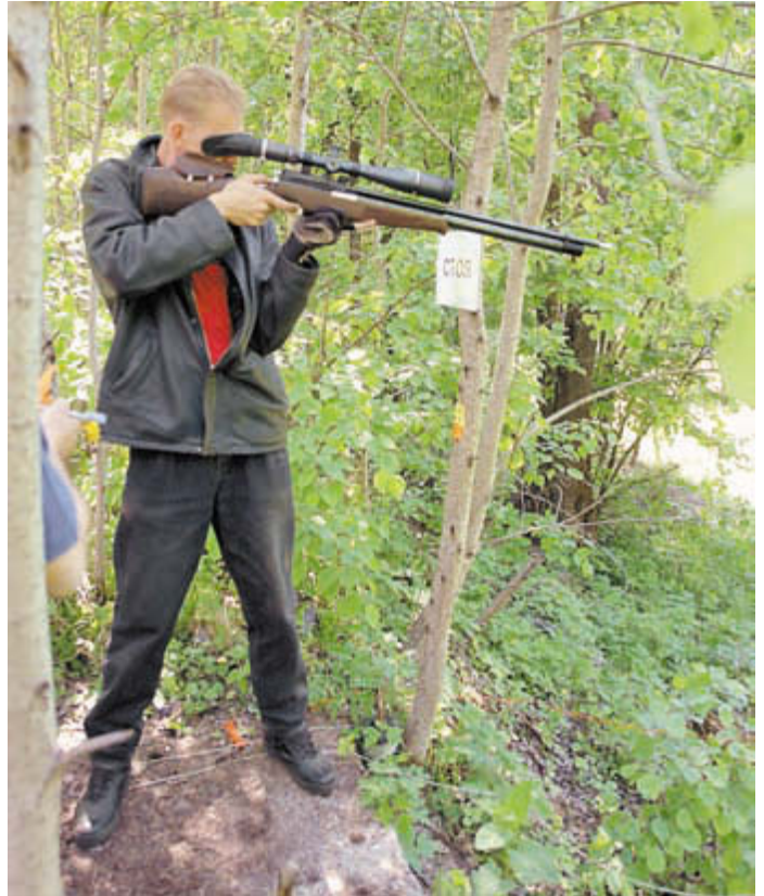
Стрельба из положения «стоя»

Следующим по порядку, но не по важности, идёт прицел. Правилами не оговаривается максимальная кратность прицелов, но в этом нет надобности – запрет на изменение фокусировки вынуждает стрелков использовать прицелы малой кратности, а запрет на внесение поправок маховиками – использовать тактические сетки для выноса