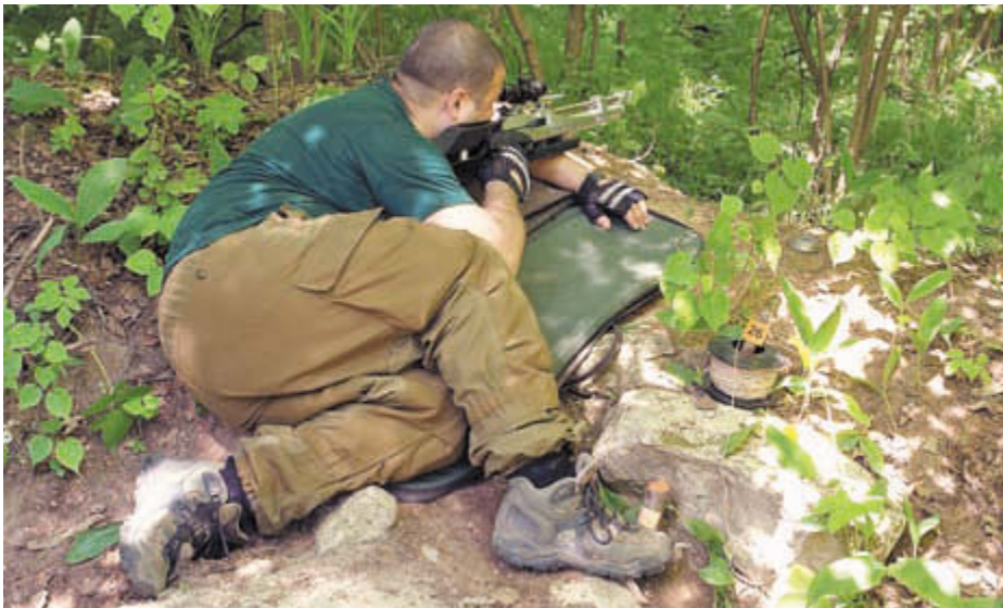
Стрелок на позиции