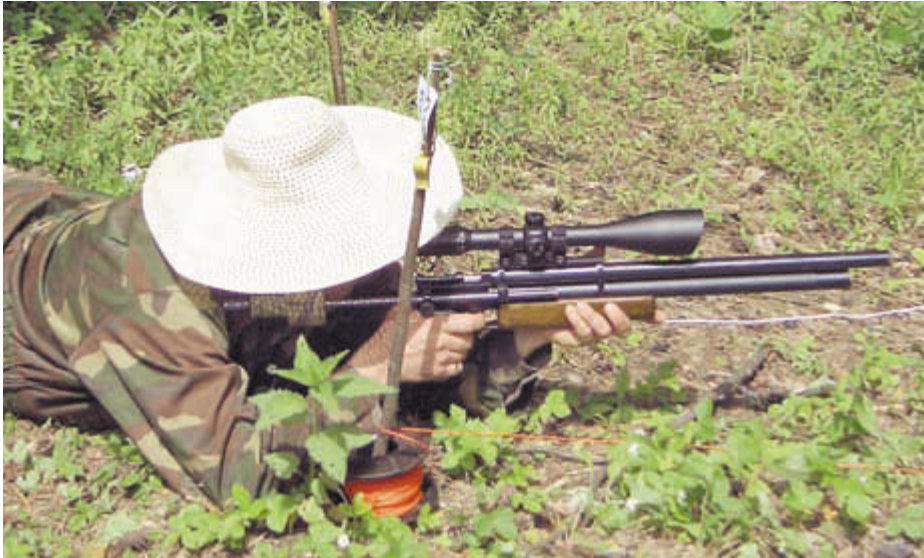
Шляпа с широкими полями очень помогает в солнечную погоду