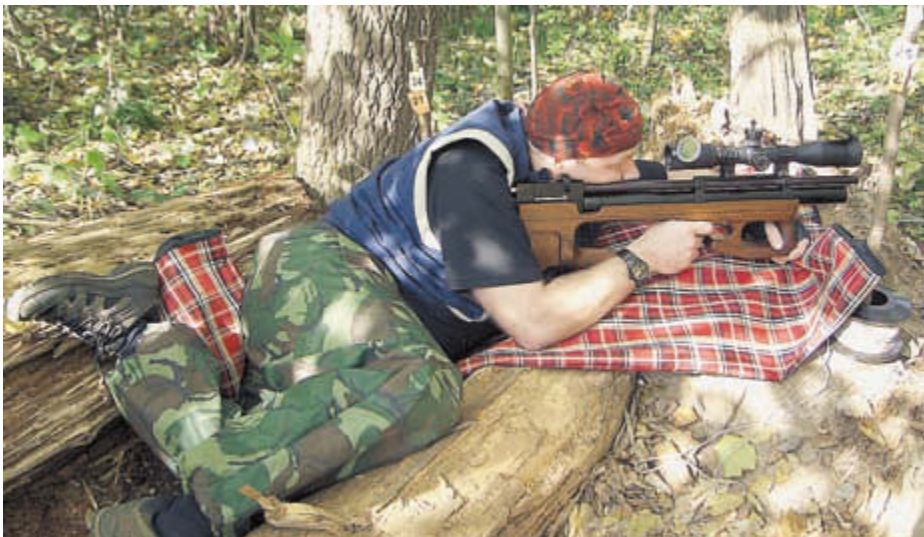
Положение лежа – самое любимое

точки прицеливания и измерения дистанции. Точность работы механизмов прицела становится не важна, на первый план выходит качество оптики и глубина резкости. Проблема ещё осложняется тем, что, как правило, оптические прицелы предназначены для стрельбы на большие расстояния, а не для диапазона 8-40 м.